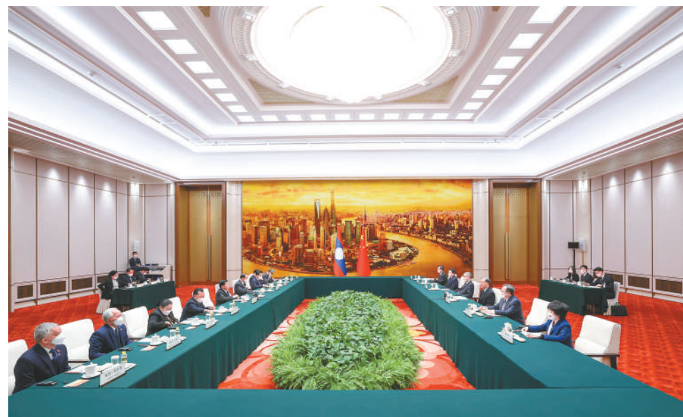
12月1日，全国政协主席汪洋在北京人民大会堂会见老挝人革党中央总书记、国家主席通伦。

汪洋表示，习近平总书记、国家主席昨天同通伦总书记、国家主席就深入推进中老命运共同体建设达成新的重要共识，为新形势下中老两国关系发展指明方向。中老是社会主义友好邻邦，命运与共。中方高度评价老挝党不断加强自身建设，领导国家经济社会发展事业取得重要成就。中国全国政协将全面贯彻落实中共二十大精神，同老挝建交70周年之际，落实好两党两国最高领导人达成的共识，深化各层级交往，为推动各自党和国家事业发展、深化中老命运共同体建设作出更大贡献。