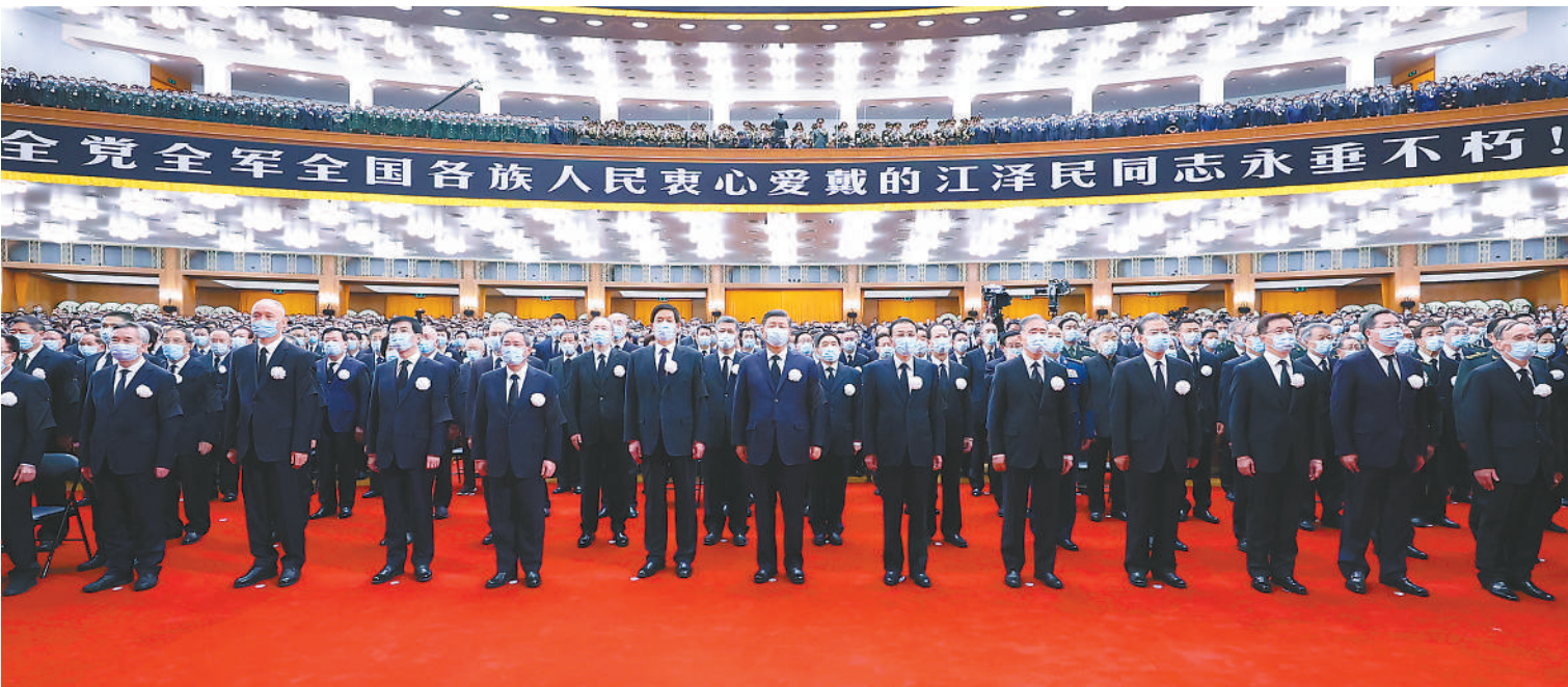
12月6日，中共中央、全国人大常委会、国务院、全国政协、中央军委在北京人民大会堂隆重举行江泽民同志追悼大会。习近平、李克强、栗战书、汪洋、李强、赵乐际、王沪宁、韩正、蔡奇、丁薛祥、李希、王岐山等参加大会。新华社记者 鞠鹏 摄