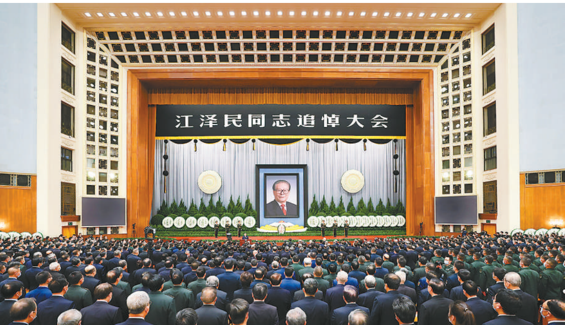
12月6日，中共中央、全国人大常委会、国务院、全国政协、中央军委在北京人民大会堂隆重举行江泽民同志追悼大会。新华社记者 丁海涛 摄