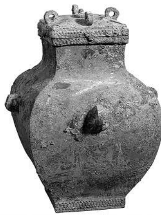
▶ 中国国家博物馆藏

此套鉴、缶器身均饰以红铜镶嵌的兽纹，鉴之口沿部位有铭文“蔡侯申之尊缶”，缶之盖、器口部位均有铭文“蔡侯申之尊缶”。