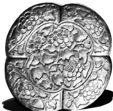
宋缠枝牡丹鎏金银盘，武汉市江夏区博物馆藏

宋缠枝牡丹鎏金银盘，直径17.1厘米，高1.5厘米，重105.2克。1982年出土于武汉市江夏区纸坊街林港桶园宋墓。葵瓣形，葵口、窄沿，斜弧腹，腹较浅，平底。盘内底叠铸出凸起的缠枝牡丹花卉纹，牡丹恣意怒放，花朵硕大，在枝叶的衬托下，呈现出牡丹“百花之王”的风采。外部分为4个区间，每个区间饰折枝牡丹一朵，花朵呈完全绽开形态，花蕊饱满，枝叶缠绕纷披，根基呈曲线，比例协调，形神兼备。