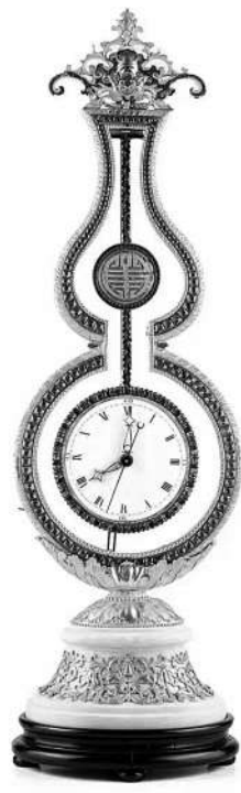
◀清乾隆 铜鎏金葫芦型西洋钟

此外，明弘治黄地青花栀子花纹盘以栀子花纹饰作装饰，内壁还饰有柿子葡萄莲花和石榴，外壁上下双圈内绘一圈缠枝芙蓉，以200万港元起拍，以480万港元成交。