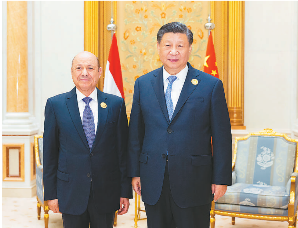
当地时间12月9日下午，国家主席习近平在利雅得会见也门总统领导委员会主席阿里米。