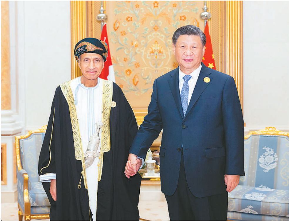
当地时间12月9日下午，国家主席习近平在利雅得会见阿曼内阁副首相法赫德亲王。