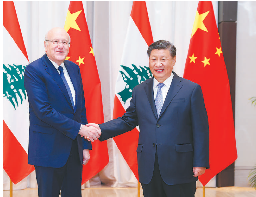
当地时间12月9日晚，国家主席习近平在利雅得会见黎巴嫩总理米卡提。