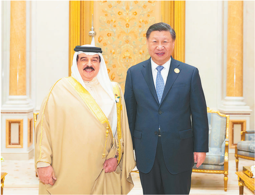
当地时间12月9日下午，国家主席习近平在利雅得会见巴林国王哈马德。