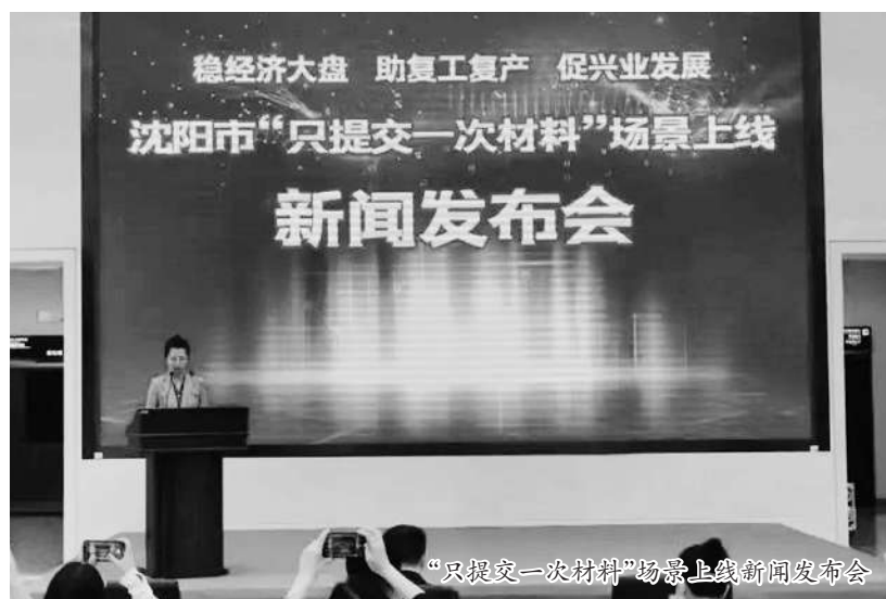
“只提交一次材料”场景上线新闻发布会

不只是群众方便，各类市场主体也是营商环境优化的最大受益者。今年，沈阳某防护技术装备有限公司急需增加流动资金以完成增量订单需求。在市金融局及行业主管部门的共同推动下，由浦发银行和盛京担保公司共同解决抵押物不足值问题，将评估值190万元的房