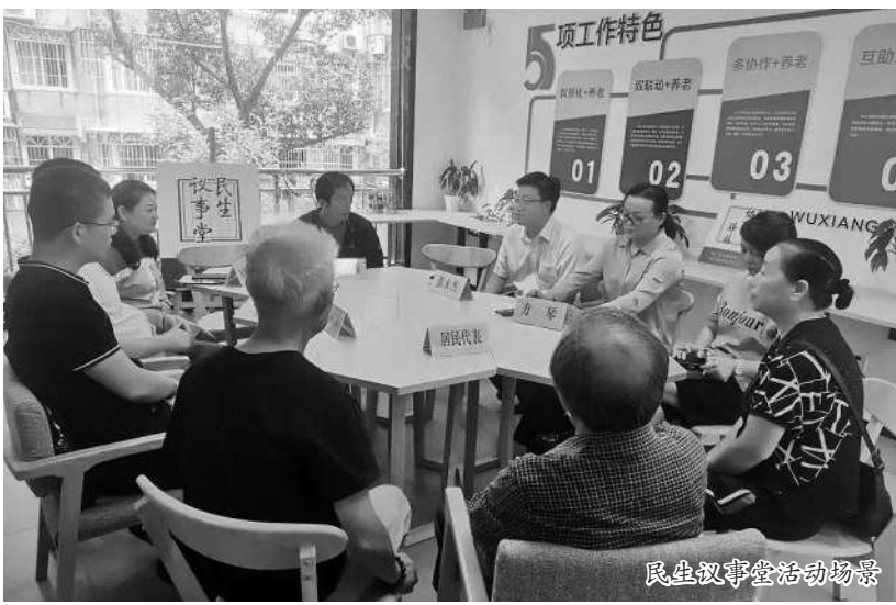
民主议事堂活动现场

对于有千余座岛屿的舟山而言，渔农村振兴事关海岛共富全局。走在普陀区展茅街道黄杨尖村，无忧酒坊、元一书坊、怪兽咖啡、彩色墙绘、美丽庭院、文艺茶舍……移步换景中，除了空中依然弥漫的海鲜味，这里早已是业态多元、村民商户安居乐业的现代场景。