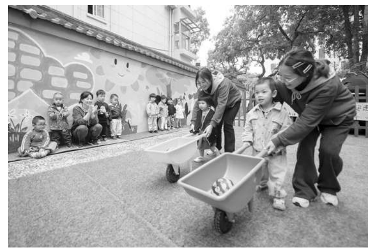
老小区建设托育中心解决居民托育难题

当前，基于多学科的家庭教育本土研究正在展开，在学术研讨的过程中，来自各学科的研究者将学科方法论和视角带到家庭教育研究中，形成了多学科参与的知识领域。高校在家庭教育学科和课程建设上已经迈出了实质性的专业步伐。