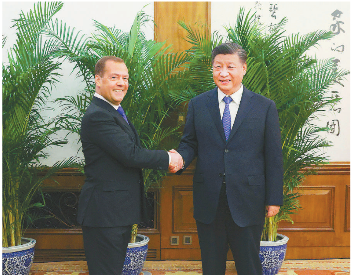
十二月二十一日，中共中央总书记、国家主席习近平在北京钓鱼台国宾馆会见应中国共产党邀请访华的俄罗斯统一俄罗斯党主席梅德韦杰夫。