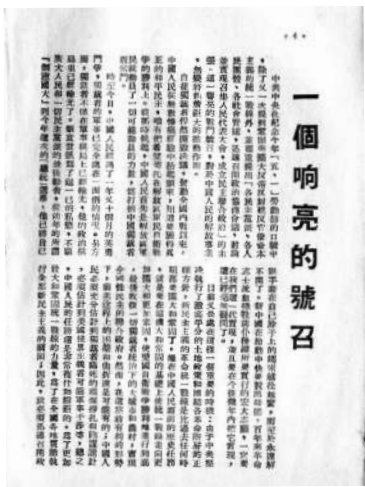
伟大的号召,迅速响应中共中央“五一口号”。由台盟主办的《新台湾丛刊》刊发《一个响亮的号召》和《响应

当年5月1日,台盟在香港出版的《新台湾丛刊》第6辑,开卷首篇为标明“新华社陕北三十日电”的新华社电讯稿《中国共产党中央委员会发布今年五一劳动节口号》,同时发表拥护五一口号的《一个响亮的号召》。这是最早发表“五一口号”并予以热烈响应的报刊。