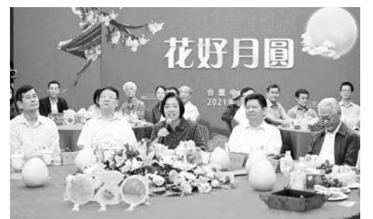
2021年9月17日,台盟中央中秋佳节线上台胞联谊活动在京举行。

抗美援朝战争结束后,美国政府在国际上推行“两个中国”阴谋,企图迫使国民党当局放弃金马地区,制造台湾与大陆“划江而治”的阴谋。这时期,中共中央解决台湾问题的着眼点是反对外国势力的干预和分裂活动,努力把台湾问题作为我国内政问题以和平方式解决。台盟拥护和中央反对美国分裂图谋、争取和平解放台湾的方针。台盟几乎每年都举行台湾人民“二二八”起义纪念集会,表达坚决反对美国侵略和制造“两个中国”“台湾独立”的阴谋,号召台湾人民为统一祖国事业贡献力量。1960年和1965年6月27日,美国侵占台湾10周年和15周年的时候,台盟各级组织纷纷集会,谴责美国妄图长期霸占台湾的阴谋。这时期,台盟总部成立“对台宣传文稿小组”,邀请台籍著名人士