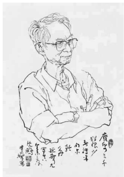
沈鹏画像 李延声 作