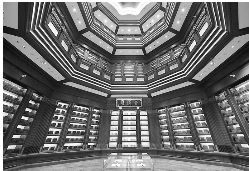
中国国家版本馆中央总馆文瀚阁文瀚厅