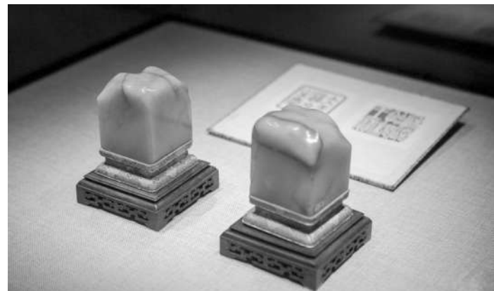
清和硕恪亲王田黄对章

同时,要求各级公安机关要突出工作重点,明确任务目标,全力推进专项行动向纵深开展。要把打击矛头始终对准盗掘古文化遗址、古墓葬犯罪,对准盗窃石窟寺石刻、古建筑及其构件和水下文物等犯罪,对准盗掘、损毁革命文物和碑刻石刻等犯罪,紧盯地下文物市场和网上交易平台,健全严防严打严管严治长效机制,坚决遏制文物犯罪多发势头。要强化文物犯罪无小案的意识,坚持现案必破,强化大案督办,开展积案攻坚,缉捕重大在逃犯罪嫌疑人。要创新打法战法,提高打击效能,不断扩大战果。要彻查涉案文物流向,文物不追回决不收兵。要加强联合防控,强化对重点单位安防指导,提升科技安防水平。要加强组织领导,压实工作责任,健全工作机制,强化统筹推进,确保专项行动取得实效。