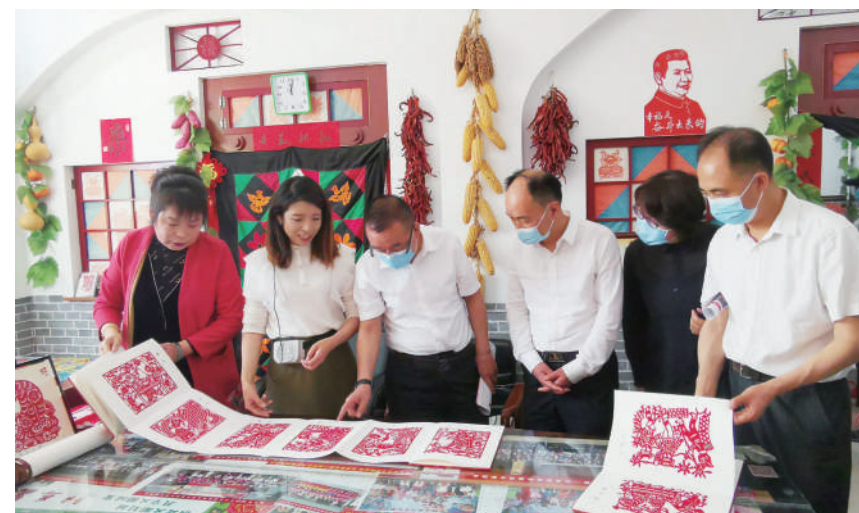
围绕月度协商议题“延续历史文脉，连接现代生活，深入实施非遗传承发展工程”，2022年5月20日，陕西省政协文化文史和学习委员会组织由部分委员、专家和民进省委有关部门负责同志组成的调研组，在铜川开展实地调研。

过去五年，省政协创新开展“让政协走进群众、让群众走进政协”实践，除“9·21”委员活动日外，还成立各级政协爱心济困协会32个，累计捐赠善款9000余万元。建成各级委员工作室1234个，开辟了融入基层治理的新阵地。认真落实委员联络制度，全面建立省政协领导联系委员、党员委员联系党外委员、专委会联系界别等机制。修订《委员履职工作规则》，建立履职档案，制定常委提交年度履职报告和委员履职情况通报等制度。通报表扬在脱贫攻坚、抗击疫情、为群众办实事等工作中表现突出的委员362人次，依照政协章