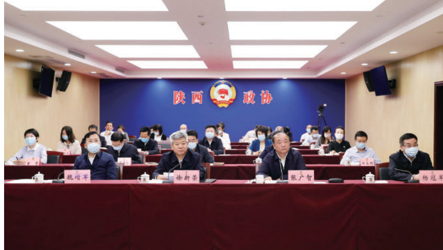
2022年9月21日，在陕西全省政协第三个“委员活动日”当天，省政协以视频形式召开“秦商量”协商议政平台使用推进会。会议通报了“秦商量”平台建设情况，省、市、县三级政协委员交流发言。

过去五年，陕西省政协的创新工作还有很多。省政协锚定新时代人民政协新任务新要求，创新建立三级联动专题民主监督工作机制，紧盯脱贫攻坚、优化营商环境等重点任务连续多年组织专题监督，每次监督必有问题清单、必有典型案例、必有协商会议，民主监督工