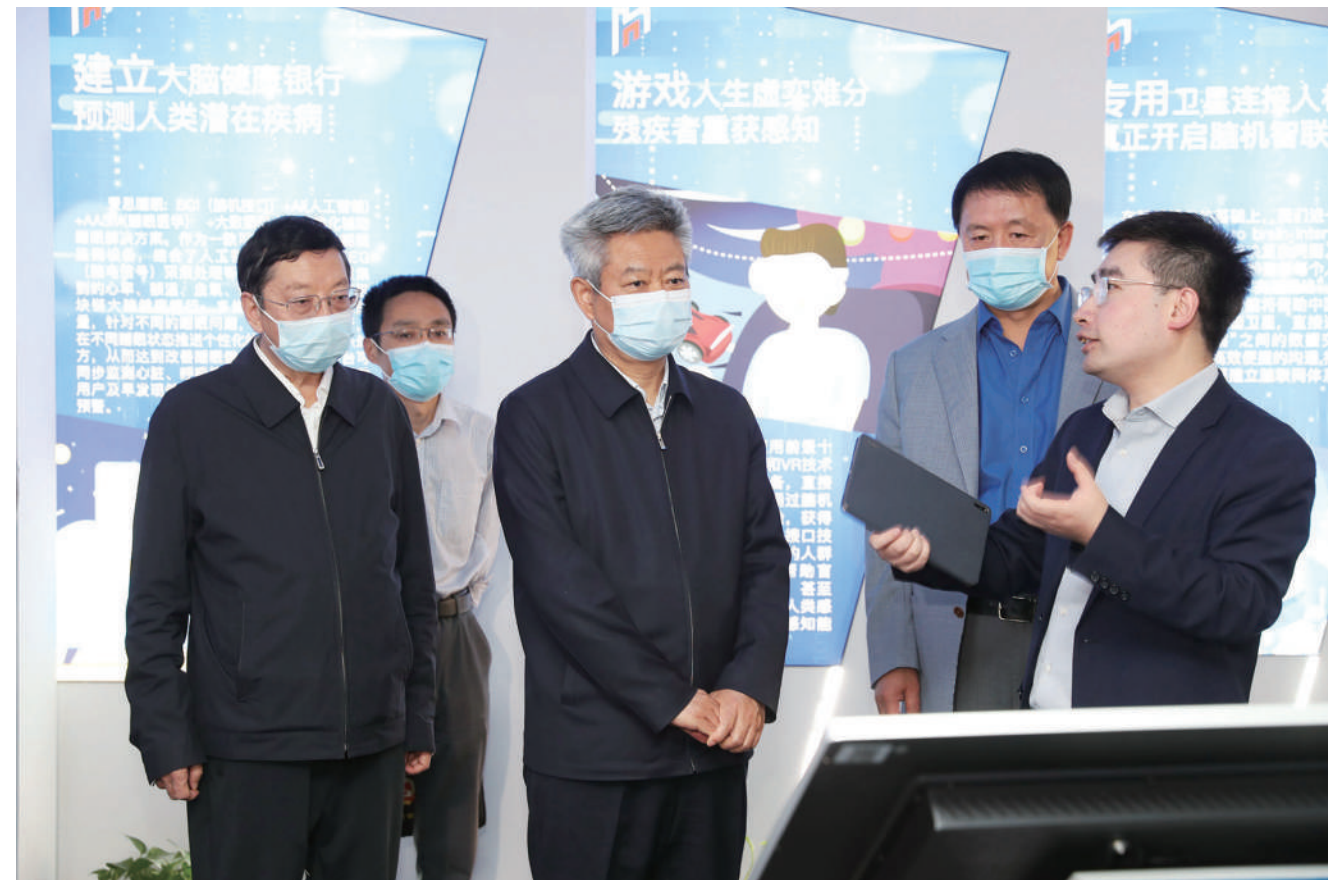
2022年4月，陕西省政协主席徐新荣率队走访调研了9家住陕全国政协委员、省政协委员领办企业和民营企业，宣讲全国两会精神，贯彻落实省委常委会（扩大）会议精神，听取企业在疫情防控常态化下存在的困难和意见建议。

动22次，累计参与3.3万人次，提交读书体会1.7万余条，形成意见建议6324条。省政协协商成效不断彰显。