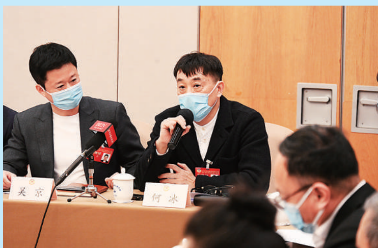
▲在文艺界小组讨论现场,委员们就繁荣首都的创意产业、文化产业人才保护、文化精品扶植等方面展开热烈讨论。 ▲在今年新设立的界别环境资源界小组讨论现场,委员们围绕绿色低碳高质量发展、科技创新助力资源行业转型升级等领域建言献策。