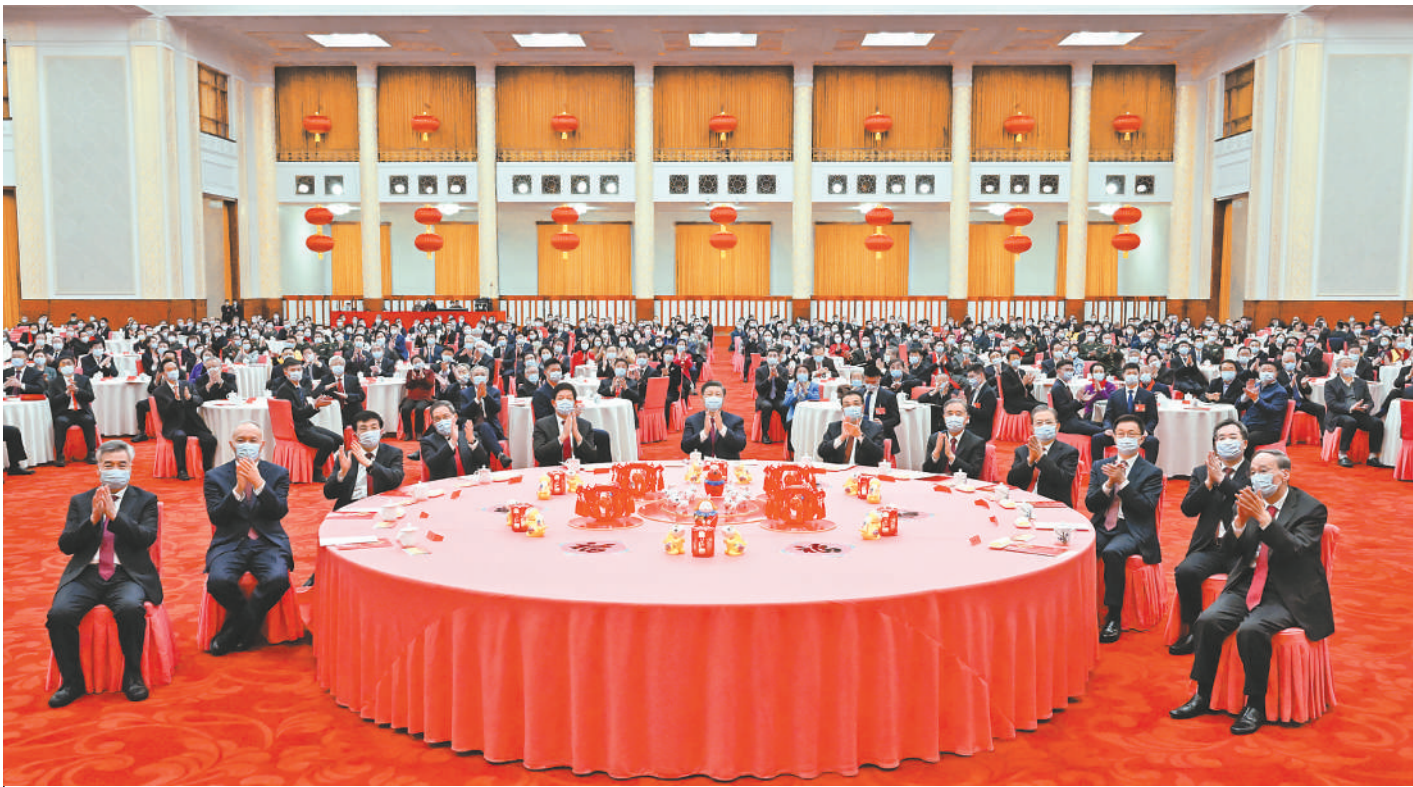
1月20日，中共中央、国务院在北京人民大会堂举行2023年春节团拜会。党和国家领导人习近平、李克强、栗战书、汪洋、李强、赵乐际、王沪宁、韩正、蔡奇、丁薛祥、李希、王岐山等首都各界人士齐聚一堂，共迎新春。