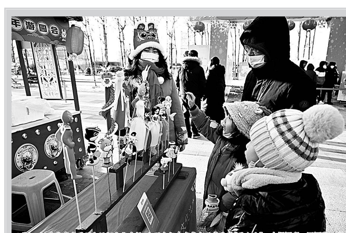
1月28日，在北京中轴线上举行兔年花灯DIY活动，小朋友们在兔年花灯DIY活动中制作兔年花灯。