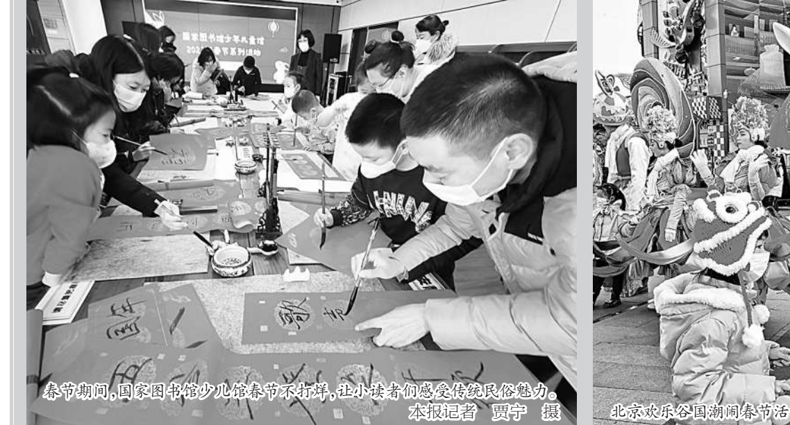
春节期间，国家图书馆少儿部春节不打烊，小朋友们感受传统文化魅力。