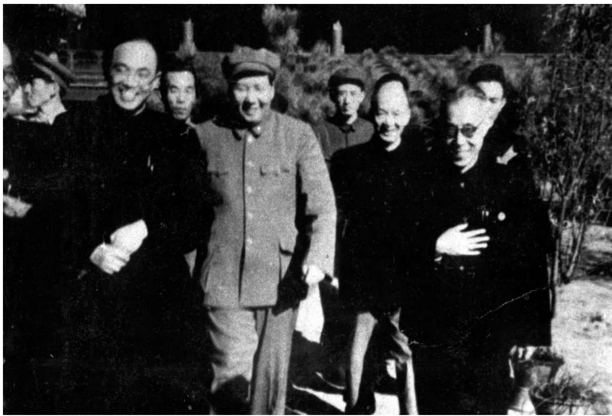
马叙伦(前排右一)陪同毛泽东走进全国工农教育会议会场

民进成立70多年来,始终与国家同呼吸、共命运,始终与中国共产党风雨同舟、荣辱与共。坚持接受中国共产党的领导,坚持爱国、民主、团结、求实,坚持立会为公是民进的优良传统。