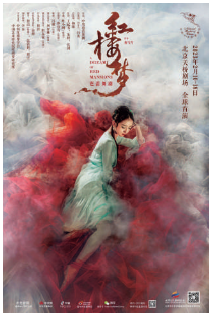
▲芭蕾舞剧《红楼梦》海报

曼妙舒展的肢体语汇、器乐和鸣的婉约交响，水袖翻飞下足尖旋转、轻纱飘逸后腾空而跃……2月10日至18日，中央芭蕾舞团原创芭蕾舞剧《红楼梦》将于北京天桥剧场首演，以芭蕾的艺术形式，再现那亦真亦幻的红楼胜景，邀观众一道以舞入“梦”，体味那娓娓道来的东方奇缘。