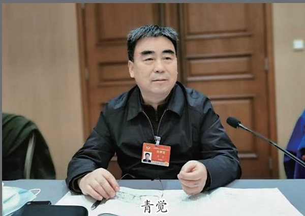
青觉 第十三届全国政协委员,中央民族大学教授、博士研究生导师。曾任中央民族大学党委常委、副校长。