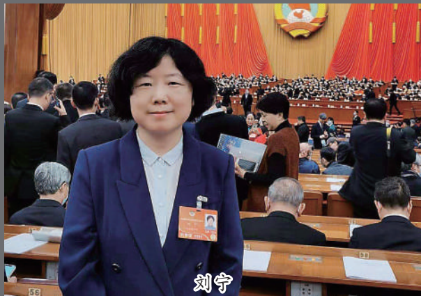
刘宁 第十三届全国政协委员,中国社会科学院文学研究所研究员、博士生导师、古典文献研究室主任,第五届中国经济社会理事会理事。