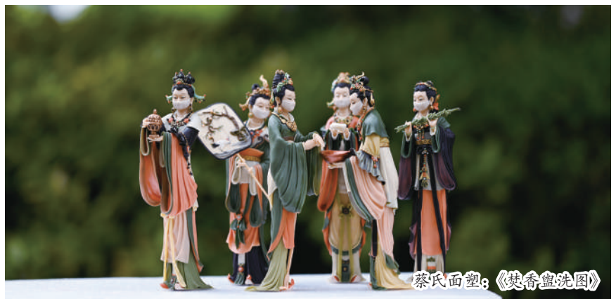
蔡氏面塑：《渔翁垂钓图》

“有了李昌钰这样知名侨胞的助力，如皋非遗一定会漂洋过海，‘圈粉’海外。”2月7日，南通非物质文化遗产“蔡氏面塑”传承人蔡晓霞欣喜万分。在江苏省如皋市统一战线各界人士新春联谊会暨非遗文化全球推广活动上，世界著名刑侦鉴识专家李昌钰等7位侨胞受聘担任非遗文化全球推广大使。 “越是民族的，越是世界的。”非遗穿越历史时空，在现代生活中绽放异彩，不仅深受国内年轻人的热捧，更在海外收获了众多粉丝。 作为长江三角洲最早见诸史册的古邑，如皋拥有6000多年的成陆史和1600多年的建县史。历史文化的积淀和传承，赋予了城市最深厚的内涵，孕育了丰富的非物质文化遗产。目前如皋共有各级非物质文化遗产项目69个，其中省级以上项目10个，国家级项目2个（如皋盆景制作技艺、如皋丝毯织造技艺），各级传承人115名，其中省级以上传承人6名，各级传承基地和保护单位40个。 “非遗文化是东方文明的精粹，更是我们心中深深的乡情。”爱吃如皋烧饼，会说正宗如皋话，无论走到哪里，“神探”李昌钰都会对家乡历史，特别是如