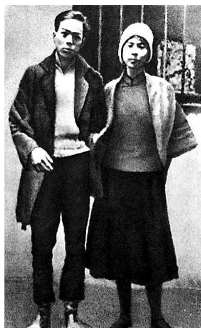
周文雍与陈铁军合影

一个是出身于富商家庭的大家闺秀，一个是身无分文的穷酸书生。在革命斗争的过程中，陈铁军与周文雍产生真挚的爱情。