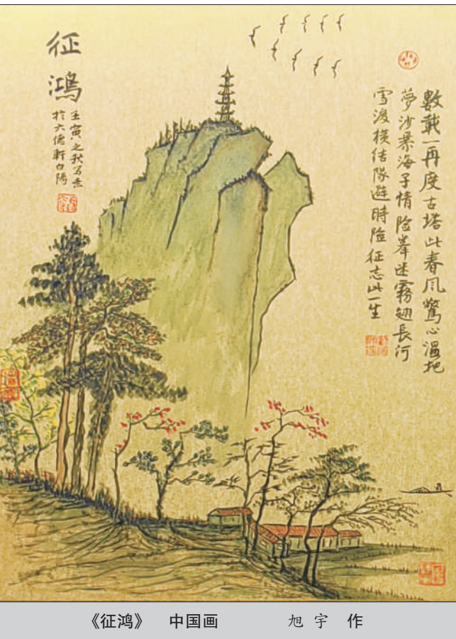
《征鸿》 中国画 旭宇作

其题破山寺后院诗 清晨入古寺，初日照高林。 曲径通幽处，禅房花木深。 山光悦鸟性，潭影空人心。 万籁此俱寂，惟闻钟磬音。