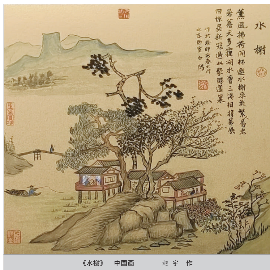
《水榭》 中国画 旭宇作