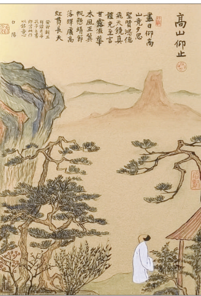
《高山仰止》 中国画 旭宇作