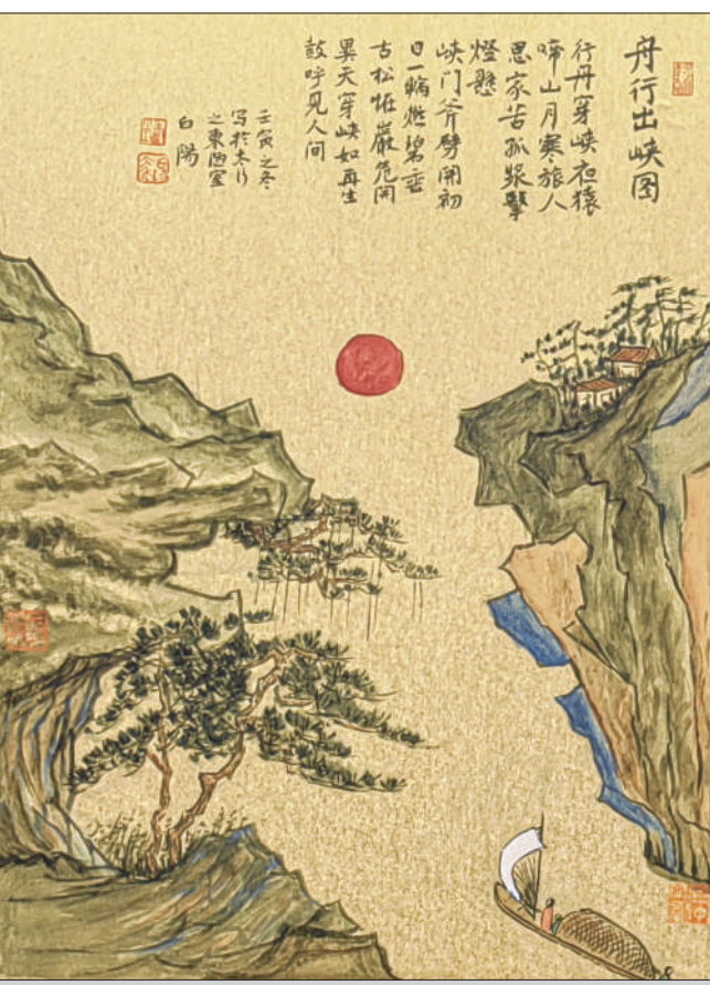
《舟行出峡图》 中国画 旭宇作