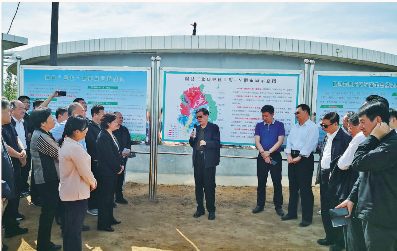
2021年5月，全国政协人口资源环境委员会在山西省围绕“三北防护林建设”开展专题调研。

创设流域、区域协商新机制。 推动设立沿黄9省区政协黄河流域生态保护和高质量发展协商研讨会、长江经济带11省市政协“共抓长江生态环境保护、共推长江经济