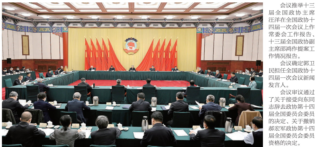
3月1日，根据全国政协十三届常委会第二十五次会议授权，全国政协在京召开第八十五次主席会议，审议全国政协十四届一次会议有关事宜。全国政协主席汪洋主持会议。

为实现党的二十大确定的目标任务而共同奋斗 ——广大干部群众认真学习领会党的二十届二中全会精神