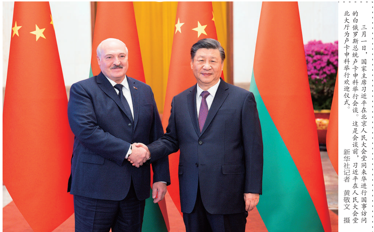
三月一日，国家主席习近平在北京人民大会堂同来华进行国事访问的白俄罗斯总统卢卡申科举行会谈。这是会谈前，习近平在人民大会堂北大厅为卢卡申科举行欢迎仪式。