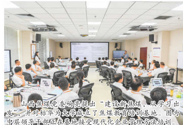
山西焦煤党委响亮提出“建设新焦煤，从学习出发”，并对标准为大学成立了焦煤教育培训基地。因为中层领导干部在基地接受现代化企业管理方法培训。