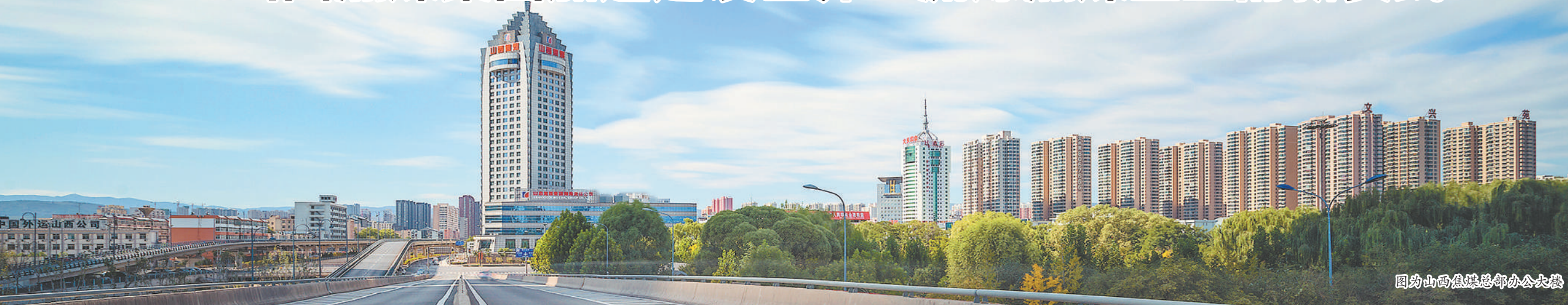
图为山西焦煤总部办公大楼