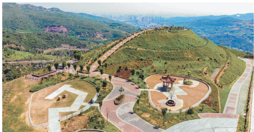
山西焦煤致力于建设“美丽焦煤”，奋力书写高质量发展的“绿色答卷”。图为山西焦煤西山煤电昔日的矸石山经过治理改造后，变成了绿意盎然的城市公园。

新焦煤咬定深化改革、全面变革不放松，一系列改革变革举措在各二级公司和基层矿厂迅速有序推进，一大批多年难以解决的问题和矛盾在统筹推进中得以破解。