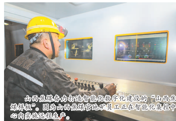
山西焦煤奋力打造智能化数字化建设的“山西焦煤智慧”。图为山西焦煤管地矿员工正在智能化集控中心内实施远程生产。