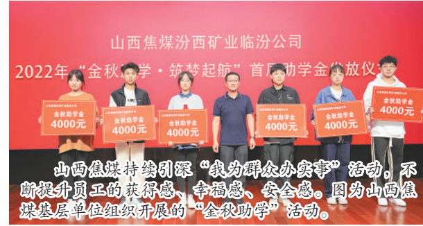
山西焦煤持续引深“我为群众办实事”活动，不断提升员工的获得感、幸福感、安全感。图为山西焦煤基层单位组织开展的“金秋助学”活动。