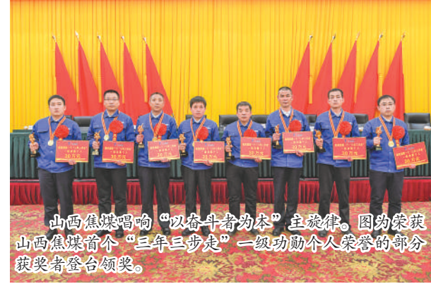
山西焦煤唱响“以奋斗者为本”主旋律。图为荣获山西焦煤首个“三年三步走”一级功勋个人荣誉的部分获奖者登台领奖。