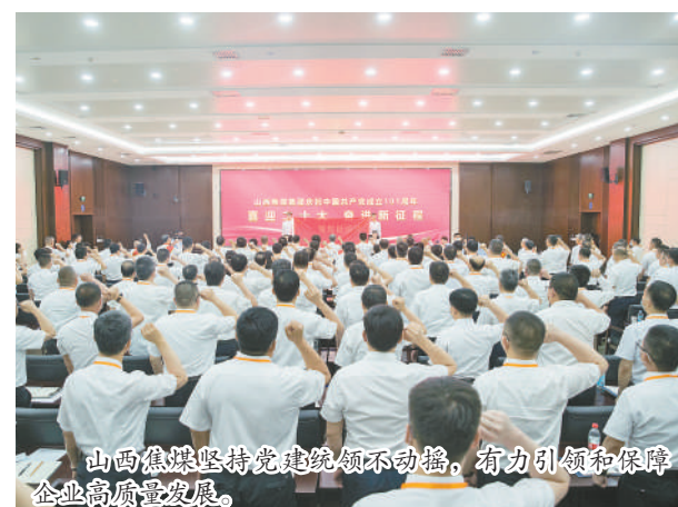
山西焦煤坚持党建引领不动摇，有力引领和保障企业高质量发展。