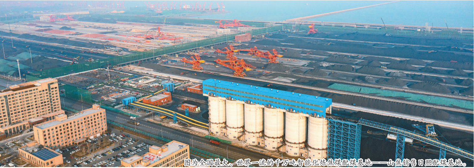
图为全国最大、世界一流的千万吨智能化炼焦煤配煤基地——山西销售日照配煤基地。