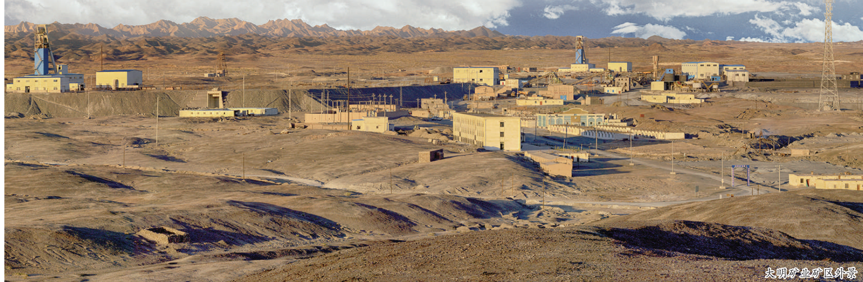
大明矿业矿区外景