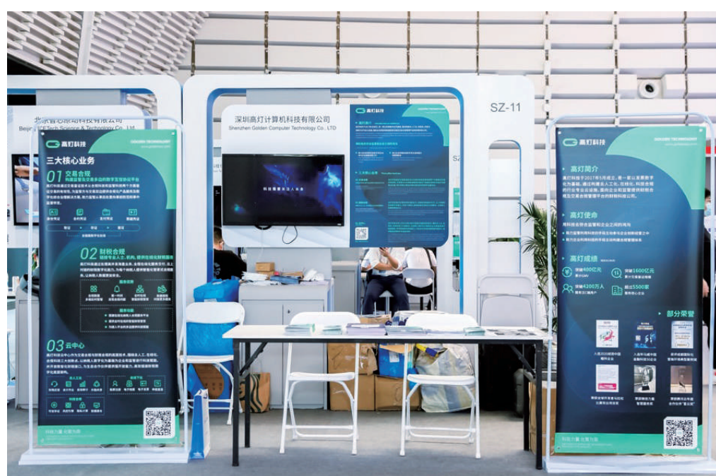
高灯科技在世界互联网大会现场