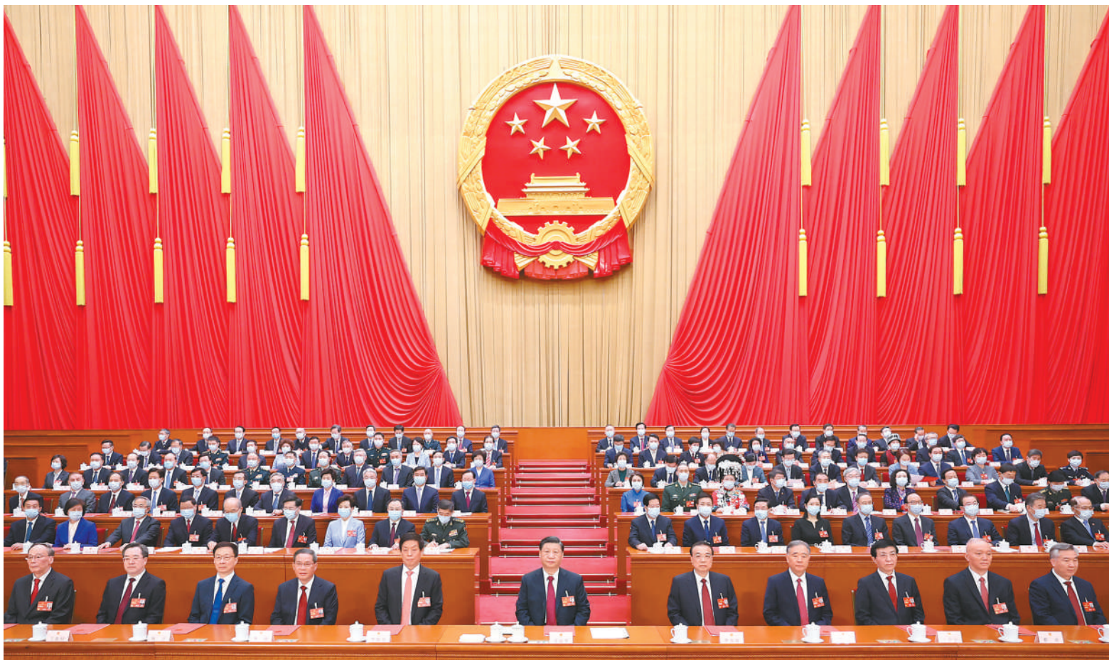
3月13日,第十四届全国人民代表大会第一次会议在北京人民大会堂闭幕。习近平等党和国家领导人在主席台就座。

新华社北京3月13日电 中华人民共和国第十四届全国人民代表大会第一次会议,在圆满完成各项议程,产生新一届国家机构组成人员后,13日上午在北京人民大会堂闭幕。