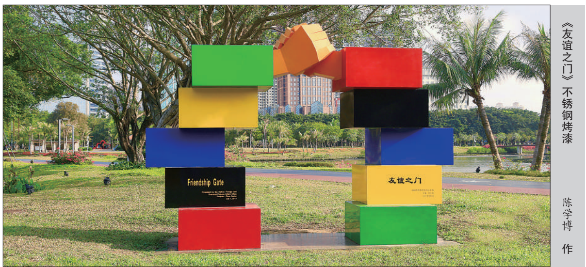
《友谊之门》不锈钢烤漆