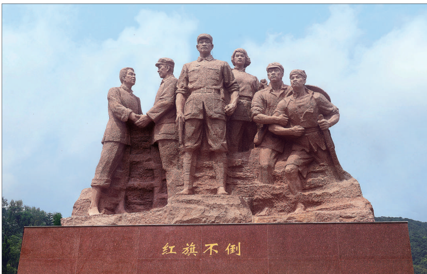
《红旗不倒》雕塑 花岗岩 立于海南万宁六连岭