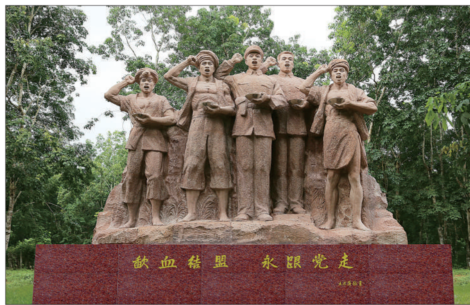
《歃血结盟》雕塑 立于海南儋州市