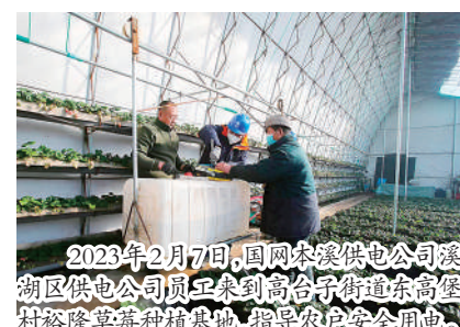
2023年2月7日，国网本溪供电公司溪湖区供电公司员工来到高台子街道东高堡村裕隆草莓种植基地，指导农户安全用电。