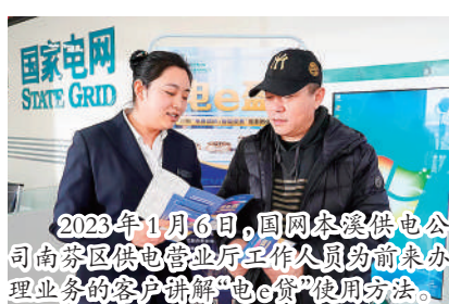
2023年1月6日，国网本溪供电公司南芬区供电公司营业厅工作人员为顾客办理业务的客户讲解“电e贷”使用方法。

经济发展，电力先行。建设卓越供电服务体系是贯彻党的二十大精神，服务人民美好生活需求，服务构建新发展格局的根本要求，是加快建设世界一流企业、实现战略目标的重要任务。在过去一年的时间里，国网本溪供电公司在营造民心氛围、优化营商环境、服务乡村振兴上勇挑重担，用心用情，聚焦解决人民群众用电急难愁盼问题，全面扛起央企责任。