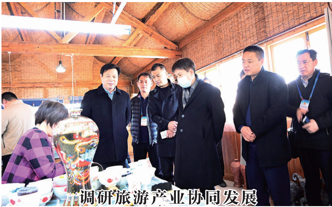
调研旅游产业协同发展

全市公安机关坚持把为民谋福祉作为工作的出发点和落脚点,认真办理委员提案、积极回应群众关切,2022年共办理答复涉交通、治安、户籍、反诈、环境污染等领域提案56件,办结率、见面率、满意率均达100%。