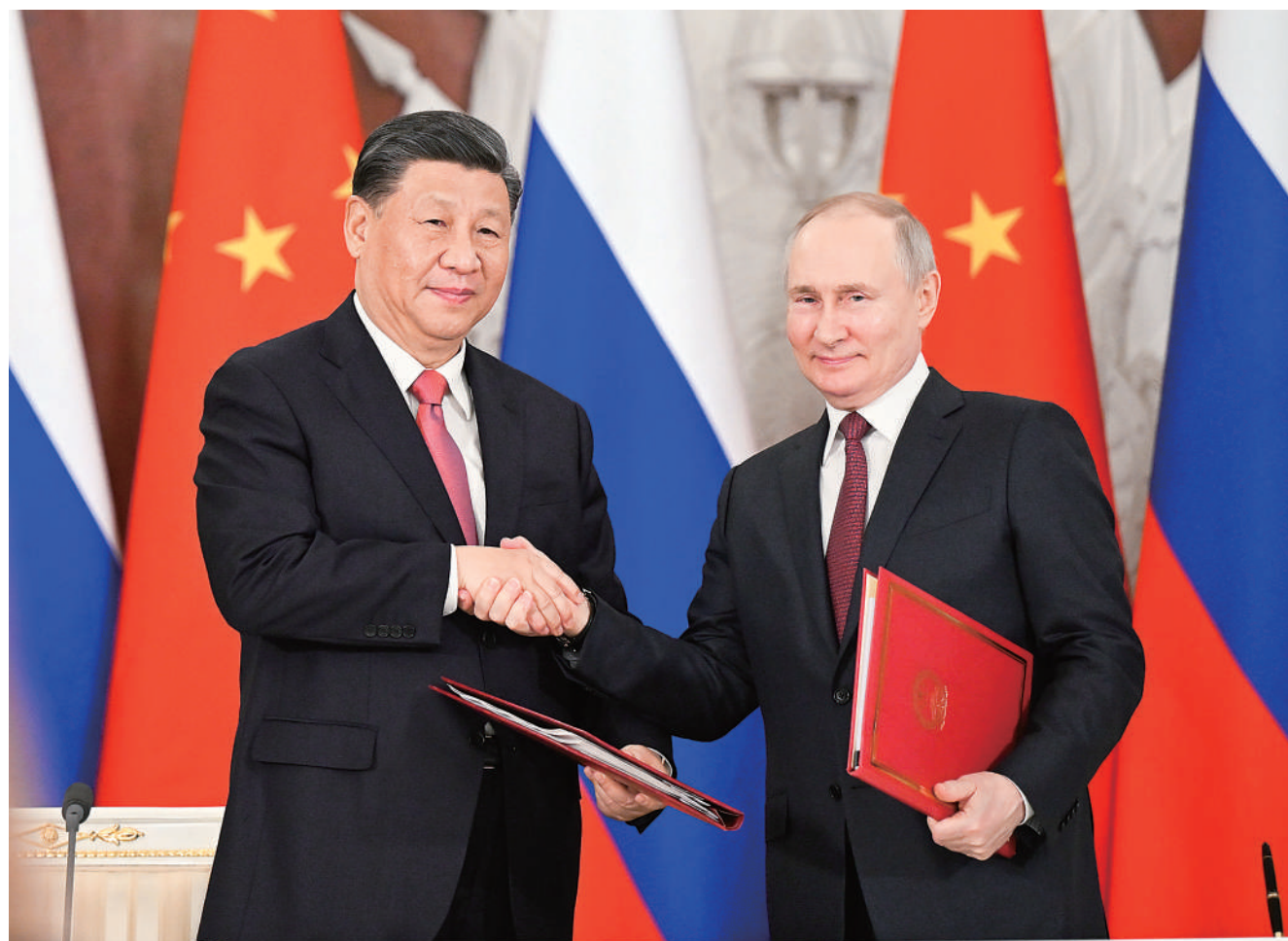
当地时间3月21日下午，国家主席习近平在莫斯科克里姆林宫同俄罗斯总统普京举行会谈。这是会谈后，两国元首共同签署《中华人民共和国和俄罗斯联邦关于深化新时代全面战略协作伙伴关系的联合声明》和《中华人民共和国主席和俄罗斯联邦总统关于2030年前中俄经济合作重点方向发展规划的联合声明》。