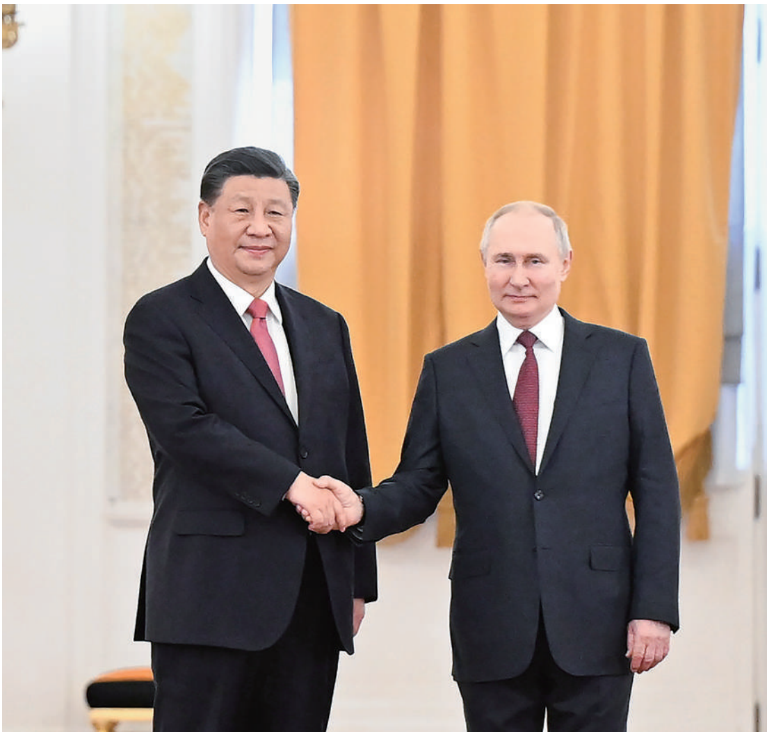
当地时间3月21日下午，国家主席习近平在莫斯科克里姆林宫同俄罗斯总统普京举行会谈。普京在乔治大厅为习近平举行隆重欢迎仪式。这是两国元首紧紧握手，合影留念。