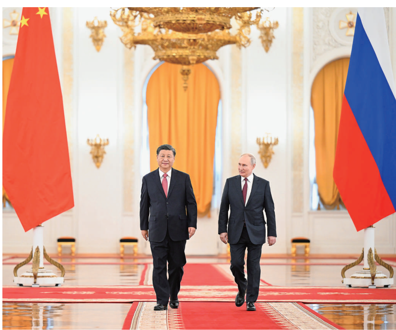
当地时间3月21日下午，国家主席习近平在莫斯科克里姆林宫同俄罗斯总统普京举行会谈。这是普京在乔治大厅为习近平举行隆重欢迎仪式。

当晚，普京在克里姆林宫为习近平举行了隆重欢迎宴会。蔡奇、王毅、秦刚，以及俄罗斯联邦政府领导人出席上述活动。