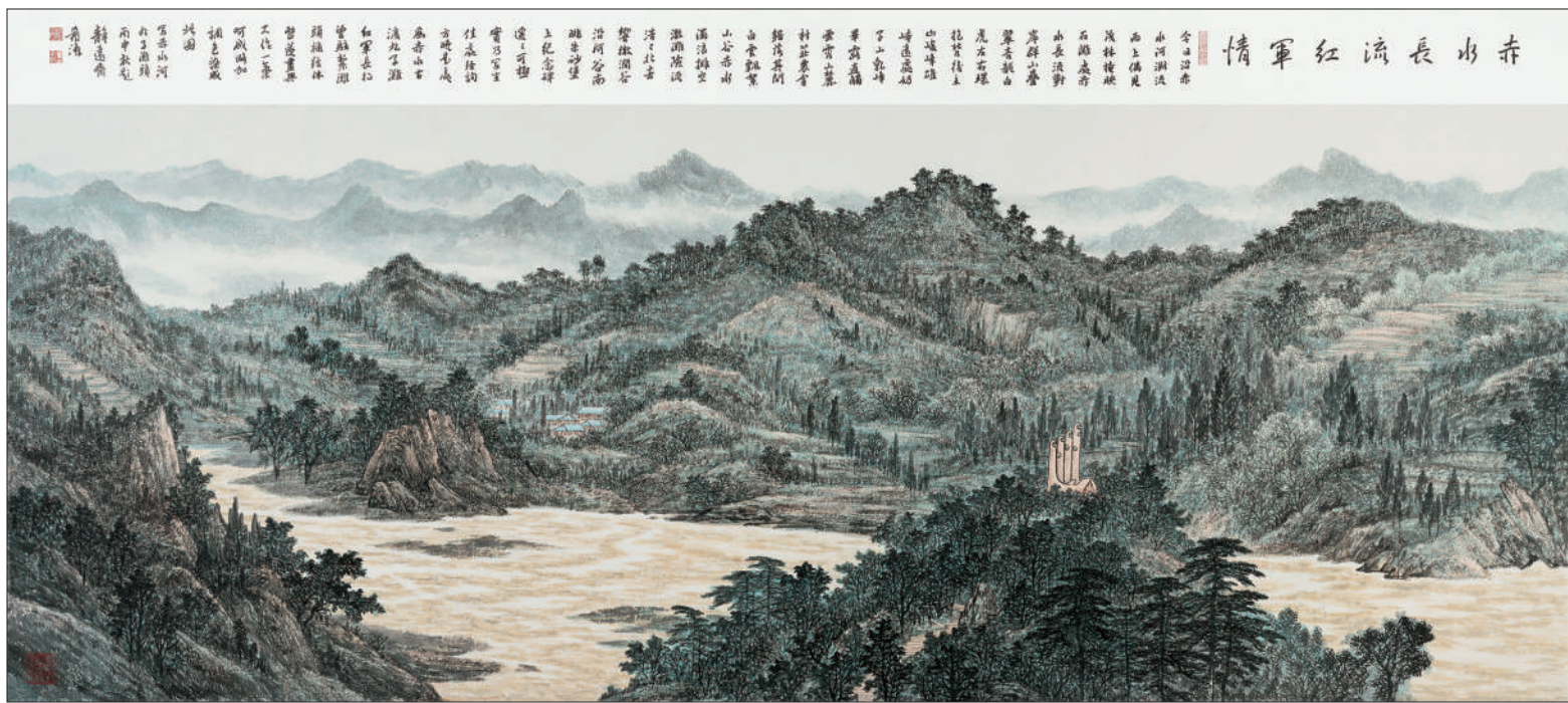
赤水长流红军情 (国画)

党的二十大庄严宣告了新时代新征程中国共产党的使命任务：“团结带领全国各族人民全面建成社会主义现代化强国、实现第二个百年奋斗目标，以中国式现代化全面推进中华民族伟大复兴。”在奋进新征程的过程中，美术工作者将同广大的文艺工作者一道，热忱描绘新时代新征程的宏大气象，弘扬中国精神、传播中国价值、凝聚中国力量，在建设好中国人民共同精神家园的同时，增强中华文明传播力影响力，推动中华文化更好地走向世界。