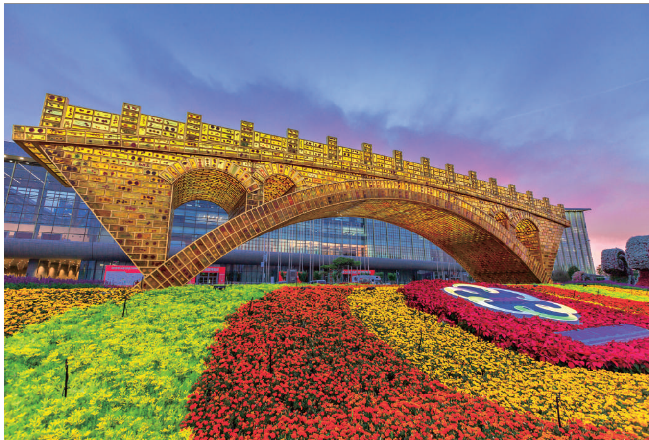
亚洲文明对话大会上的丝路金桥 (装置 雕塑)