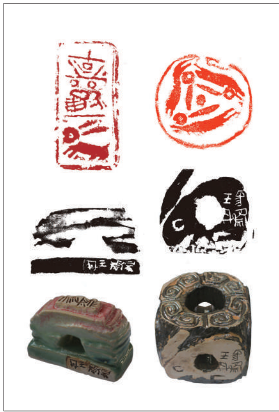
古欢兔 肖形兔 (虎溪陶陶瓷印) 王丹 作