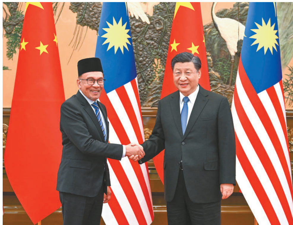
3月31日下午，国家主席习近平在北京人民大会堂会见来华进行正式访问的马来西亚总理安瓦尔。