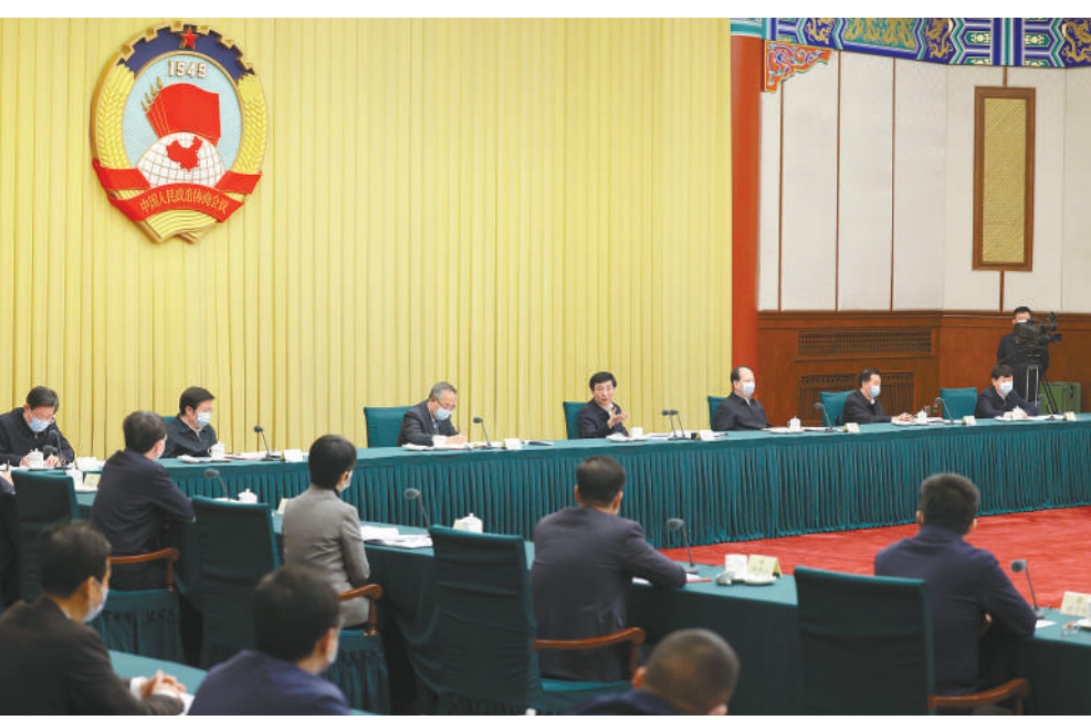
3月31日，十四届全国政协第一次双周协商座谈会在北京召开，中共中央政治局常委、全国政协主席王沪宁主持会议。

本报讯（记者 吕巍）十四届全国政协第一次双周协商座谈会3月31日在京召开，中共中央政治局常委、全国政协主席王沪宁主持会议。他表示，要深入学习贯彻习近平总书记关于构建新发展格局、推进中国式现代化的重要论述，深刻领悟“两个确立”的决定性意义，增强“四个意识”、坚定“四个自信”、做到“两个维护”，牢牢把握协商议政的根本遵循和着力重点，以高质量协商议政活动助推中共中央决策部署落实。