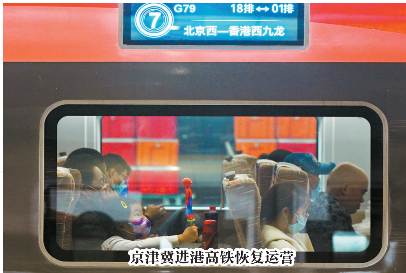
京津冀进港高铁恢复运营