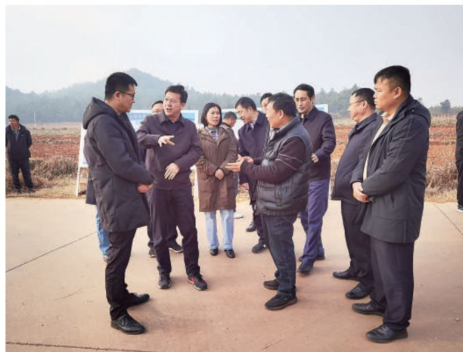
云南省曲靖市沾益区政协组织开展“打造白水镇特色产业带，助力乡村振兴”协商议事会议。