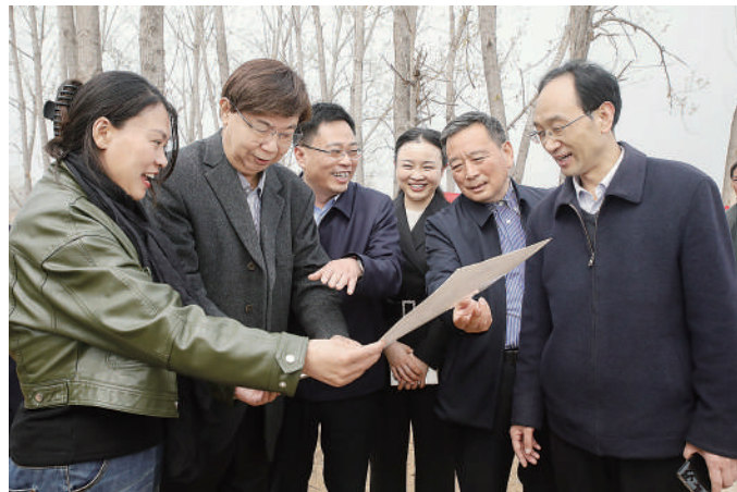
河南省尉氏县政协组织委员赴门楼任乡沙沃村千亩果园开展实地调研，助力乡村振兴。