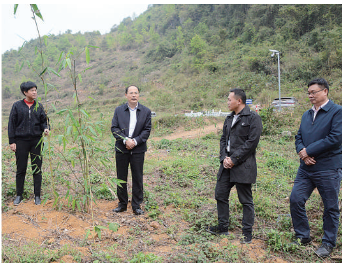
广西壮族自治区来宾市政协组织调研组到忻城县红渡镇马蹄村调研乡村振兴工作，共谋发展良策。