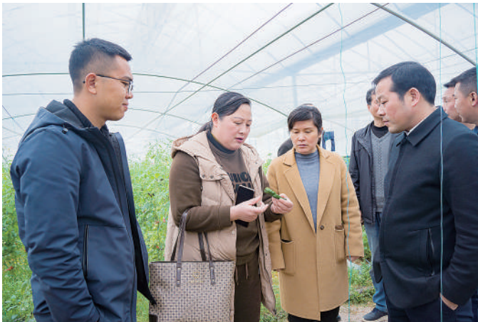
江西省金溪县政协组织委员深入双塘镇蔬菜产业基地视察调研。