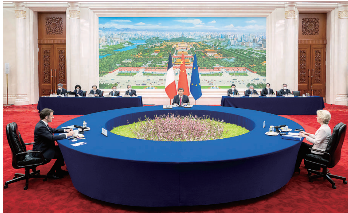
四月六日下午，国家主席习近平在北京人民大会堂同法国总统马克龙、欧盟委员会主席冯德莱恩举行中法欧三方会晤。

新华社北京4月6日电（记者刘华）4月6日下午，国家主席习近平在人民大会堂同法国总统马克龙、欧盟委员会主席冯德莱恩举行中法欧三方会晤。习近平指出，中欧双方有着广泛共同利益，合作大于竞争，共识多于分歧。当前，国际形势复杂多变，中欧双方应该坚持相互尊重，增进政治互信，加强对话合作，共同维护世界和平稳定，促进共同发展繁荣，携手应对全球性挑战。今年是中国同欧盟建立全面战略合作伙伴关系20周年。中方愿同欧方一道，把握好中欧关系发展大方向和主基调，全面重启各层级交往，激活各领域互利合作，为中欧关系发展和世界和平、稳定、繁荣注入新动力。（下转2版）