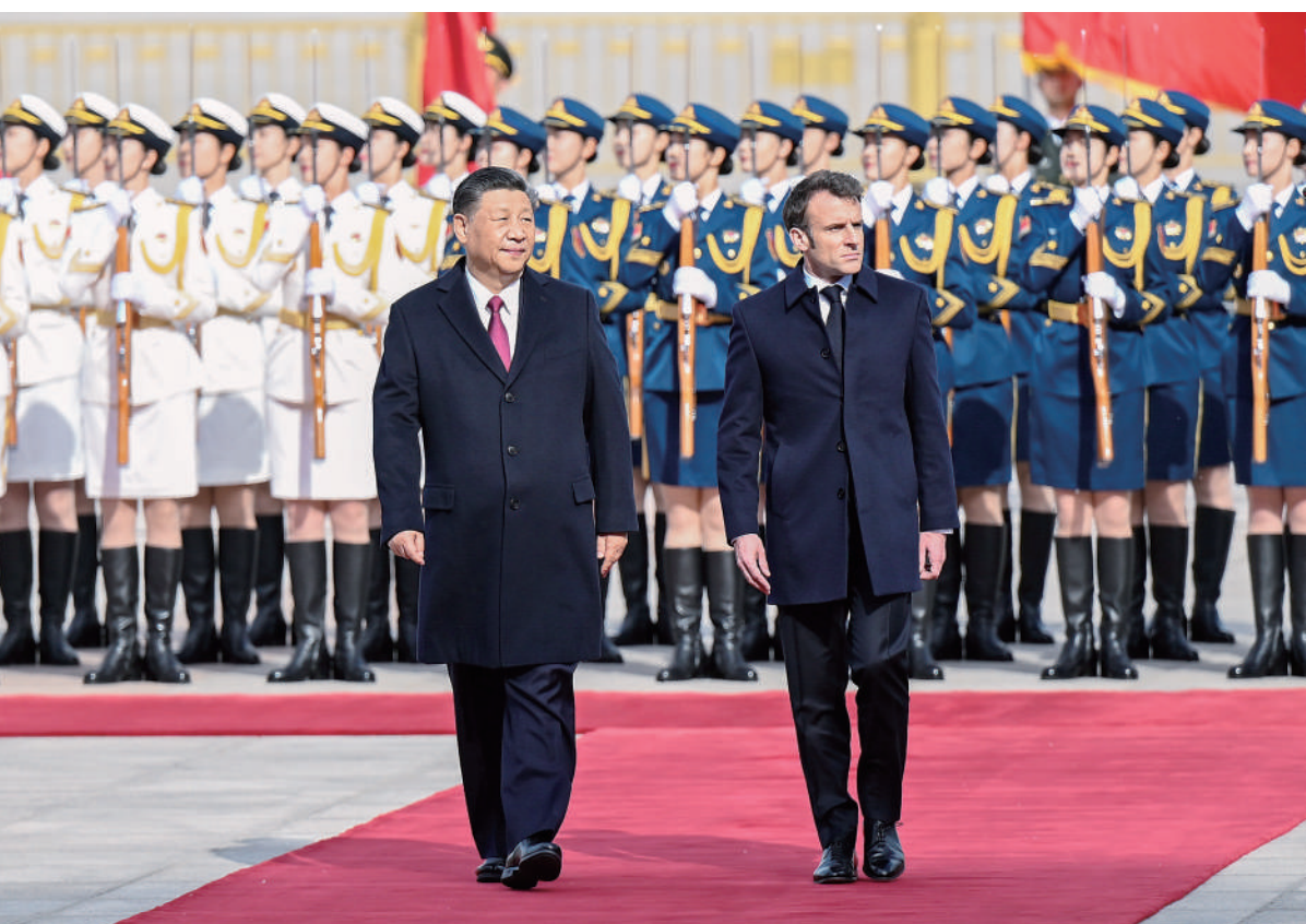
四月六日下午，国家主席习近平在北京人民大会堂同法国总统马克龙举行会谈。这是会谈前，习近平在人民大会堂东门外广场为马克龙举行欢迎仪式。

新华社北京4月6日电（记者刘华）4月6日下午，国家主席习近平在人民大会堂同法国总统马克龙举行会谈。习近平指出，当今世界正在经历深刻的历史之变，中法作为联合国安理会常任理事国和具有独立自主传统的大国，作为世界多极化、国际关系民主化的坚定推动者，有能力、有责任超越分歧和束缚，坚持稳定、互惠、开拓、向上的中法全面战略伙伴关系大方向，践行真正的多边主义，维护世界和平、稳定、繁荣。习近平高度评价中法关系保持积极稳健发展势头，强调指出，稳定性是中法关系的突出特征和宝贵财富，值得双方精心呵护。双方要用好两国全方位、高水平沟通渠道，保持两国元首密切沟通，今年年内举行中法战略、经济财金、人文交流三大高级别对话机制新一轮会议。双方要相互尊重对方主权和领土完整，尊重对方核心利益，妥善处理管控分歧。要坚持互惠互利、共同发展。中国正在大力推进高质量发展和高水平开放，这将为法方提供更广阔市场机遇。（下转3版）