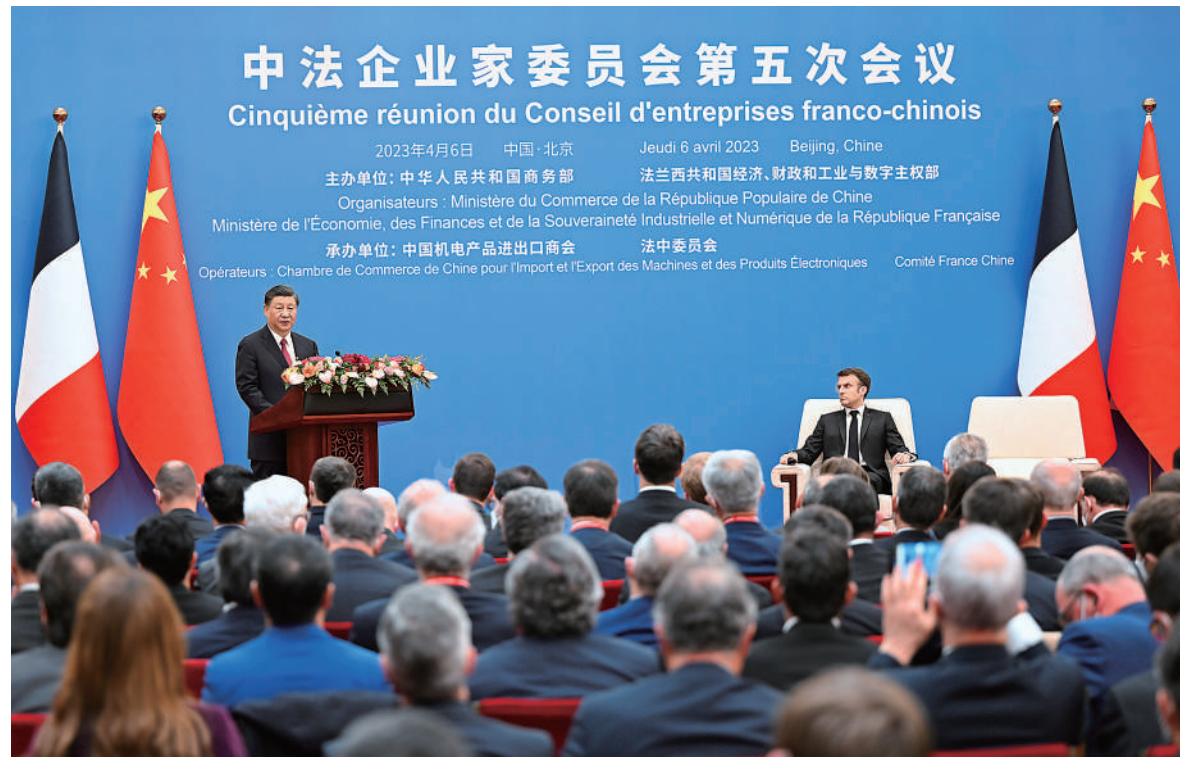
四月六日下午，国家主席习近平在北京人民大会堂出席中法企业家委员会第五次会议闭幕式并致辞。

新华社北京4月6日电（记者刘华）4月6日下午，国家主席习近平在北京人民大会堂出席中法企业家委员会第五次会议闭幕式并致辞。习近平指出，世界正发生深刻复杂变化。面对困难和挑战，中法两国坚持真正的多边主义，坚持自由贸易和经济全球化正确方向，极大增强了双边经贸合作的韧性和活力。双边贸易额和相互直接投资稳步增长，大项目合作深入推进，绿色消费、绿色能源、科技创新等新兴领域合作不断拓展。中法经贸合作不仅助推两国经济发展、增进民生福祉，而且为世界经济复苏增强了信心、稳定了预期。当前，中国经济社会活力充分释放，中法、中欧各领域对话合作全面激活。（下转2版）