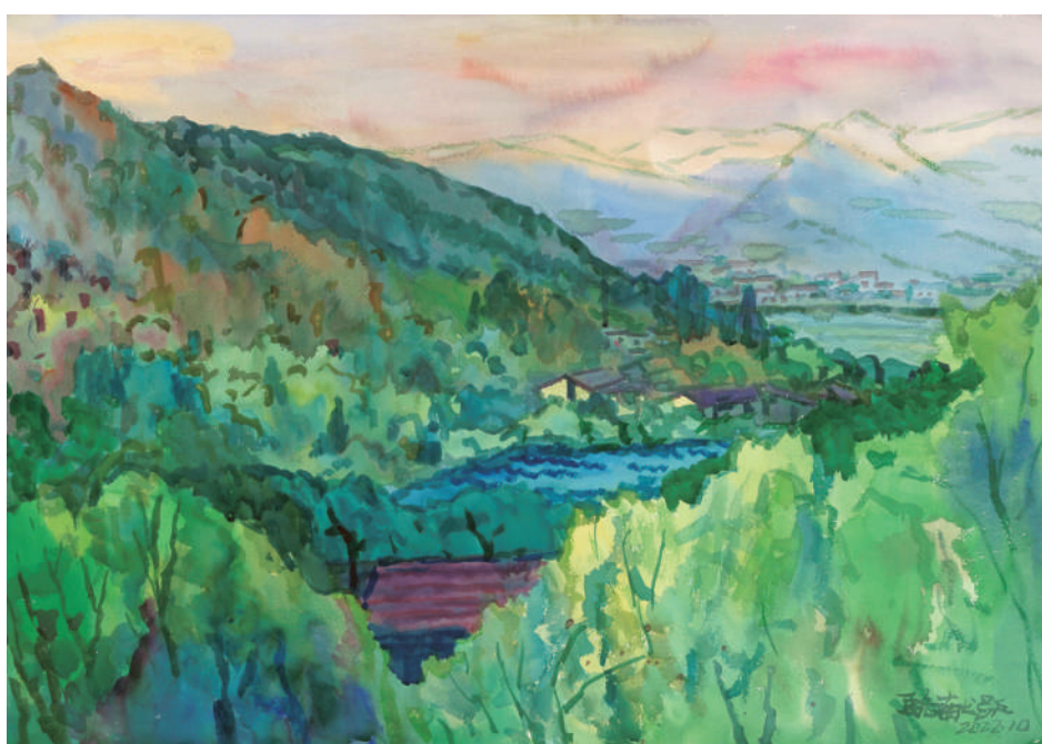
富春江芳草地之一 (水彩)