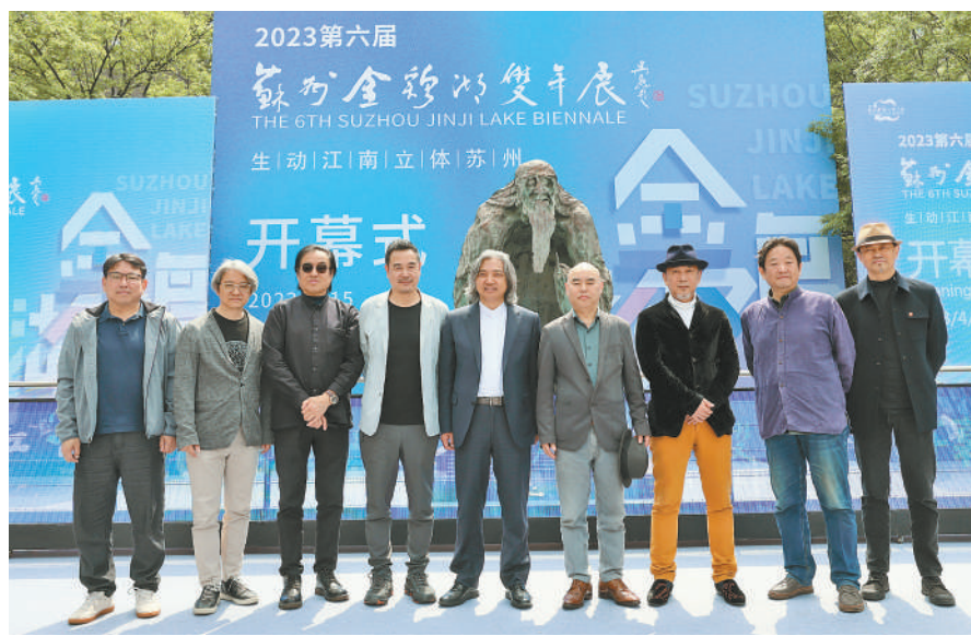
4月15日,由中国城市雕塑家协会学术指导,苏州工业园区管理委员会主办,苏州工业园区宣传和统战部、苏州圆融发展集团有限公司、南京大学雕塑艺术研究所承办,江苏省雕塑家协会学术支持的“2023第六届苏州金鸡湖双年展”在李公堤街区老子广场开幕。

自2018年把《人生归途》书稿交给海天出版社之后,我便琢磨着写一部更接地气、乡土气息更加浓郁、通海口特色更加鲜明的长篇,即现在奉献给大家的《葵花金黄色》。确定这一方向之后,并未匆匆动笔,而是花