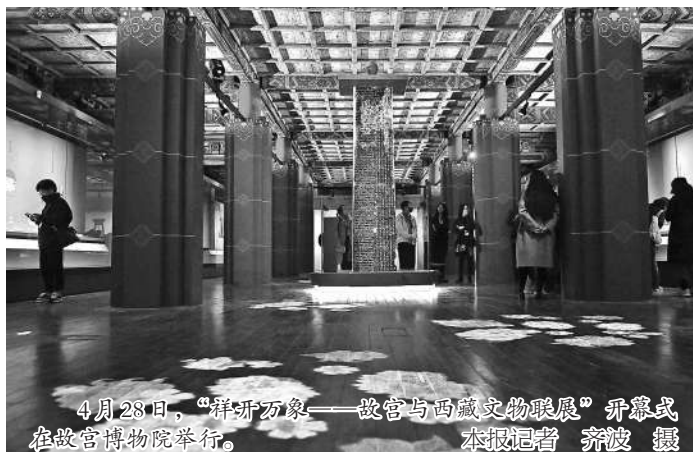
4月28日,“祥开万象——故宫与西藏文物联展”开幕式在故宫博物院举行。

休刊启事 “五一”假期期间,本报5月1日—3日休刊,5月4日恢复正常出版。祝广大读者节日快乐! 本报编辑部