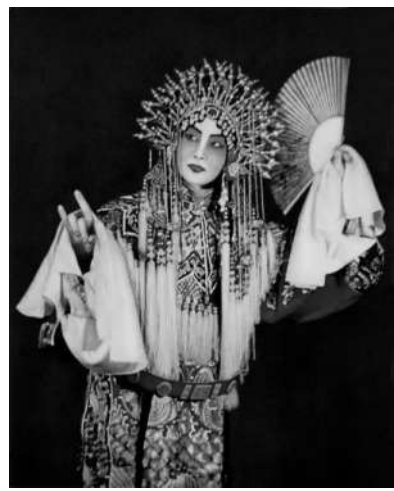
▲丑行:梅兰芳《贵妃醉酒》饰杨贵妃