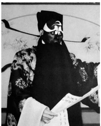
▲净行:裘盛戎《铡美案》饰包拯

年妇女,以唱功见长。如《贵妃醉酒》里的杨玉环,《西厢记》里的崔莺莺等,大家闺秀的形象居多。