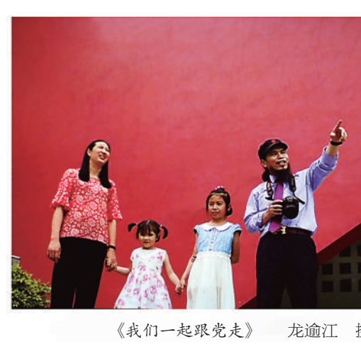
《我们一起跟党走》