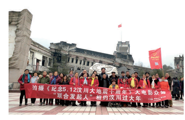
《感恩奋进》 中国·再创业