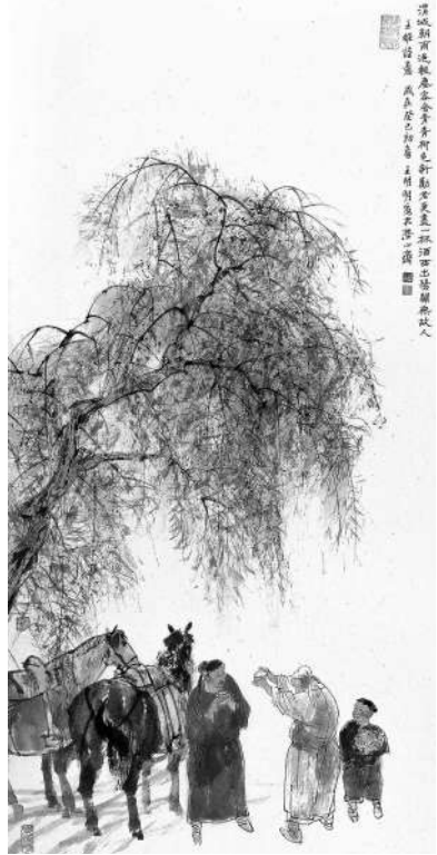
▲王维《渭城曲》（局部）王明明 2013年作

在《尚书·尧典》中就提到了。到了西晋，陆机在《文赋》中又提出“诗缘情”的理论。有人认为“言志”偏向严肃、正大的主题，“缘情”则是偏向抒发个性化、私人化的情感，把二者对立起来了。但我想，从唐宋诗词来看，“言志”和“抒情”并不是对立的。情与志在唐宋人看来是一个人的内心世界，包括对生活的感受和思考，也包括对万事万物的价值判断。这都是古典诗词所包含的内容。既然如此，唐宋诗词的内容就跟现代人没有什么距离了，因为诗词中表达的那些内容都是普通人的基本情感、基本人生观和基本价值观念。比如喜怒哀乐，比如对真善美的肯定和追求，比如对祖国大好河山的热爱、对保家卫国的英雄行为的赞美，唐宋人如