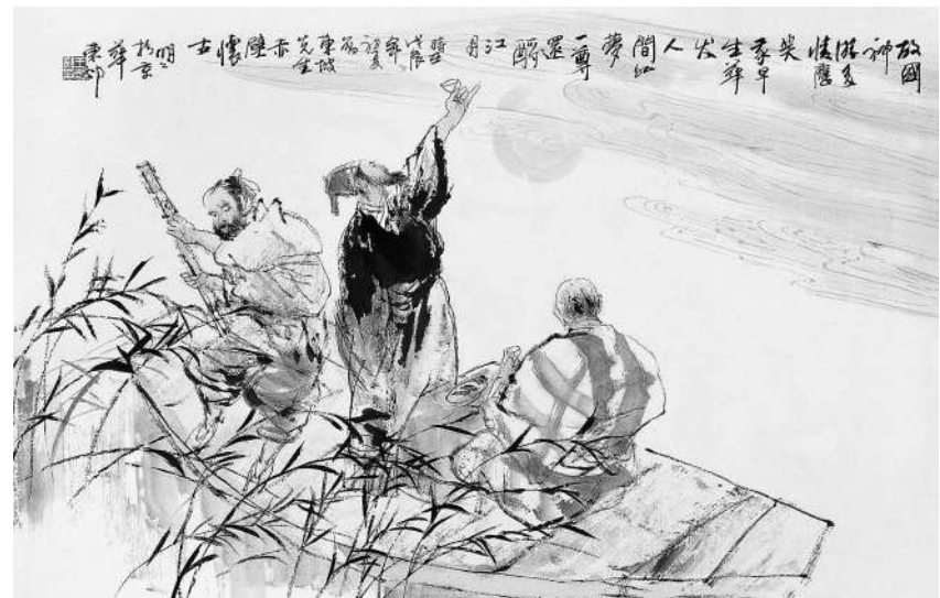
▲苏轼《赤壁怀古》 第九届全国政协委员、第十至十二届全国政协委员王明明 1988年作

四位诗人四重意义。总的来说，李杜苏辛的作品，不仅具有审美价值，更重要的是对于我们具有提升人格境界的熏陶作用。阅读唐宋诗词典范作品，可以在审美享受中不知不觉受到感染。这个过程就像杜甫所描写的成都郊外的那场春雨一样，“随风潜入夜，润物细无声。”唐宋诗词虽然距离我们有800年乃至1400年的距离，但实际上它始终是活在现代读者心头的活的文本，这是它最大的现代意义。