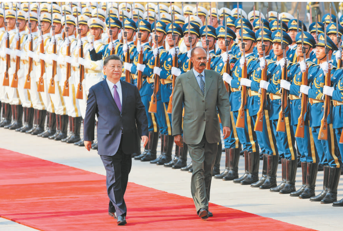
五月十五日下午,国家主席习近平在北京人民大会堂同来华进行国事访问的厄立特里亚总统伊萨亚斯举行会谈。这是会谈前,习近平在人民大会堂东门外广场为伊萨亚斯举行欢迎仪式。

新华社北京5月15日电(记者郑明达)5月15日下午,国家主席习近平在人民大会堂同来华进行国事访问的厄立特里亚总统伊萨亚斯举行会谈。