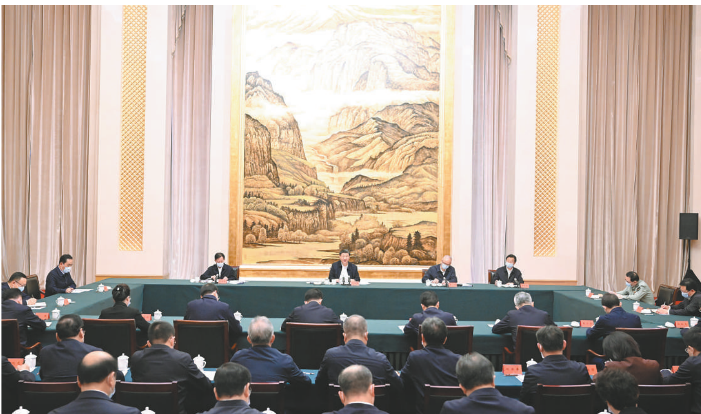
5月17日上午,中共中央总书记、国家主席、中央军委主席习近平在陕西西安主持中国—中亚峰会前夕,专门听取陕西省委和省政府工作汇报,发表了重要讲话。