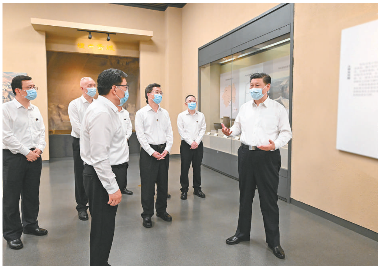
5月16日下午,中共中央总书记、国家主席、中央军委主席习近平在前往陕西西安主持中国—中亚峰会途中,在山西运城博物馆考察。

新华社陕西西安/山西运城5月17日电 中共中央总书记、国家主席、中央军委主席习近平在听取陕西省委和省政府工作汇报时强调,陕西在推进中国式现代化建设中要有勇立潮头、争当时代弄潮儿的志向和气魄,奋力追赶、敢于超越,在西部地区发挥示范作用。要完整、准确、全面贯彻新发展理念,紧紧围绕高质量发展这个首要任务,着眼全国发展大局,立足陕西实际,发挥自身优势,明确主攻方向,主动融入和服务构建新发展格局,努力在实现科技自立自强、构建现代化产业体系、促进城乡区域协调发展、扩大高水平对外开放、加强生态环境保护等方面实现新突破,奋力谱写中国式现代化建设的陕西篇章。