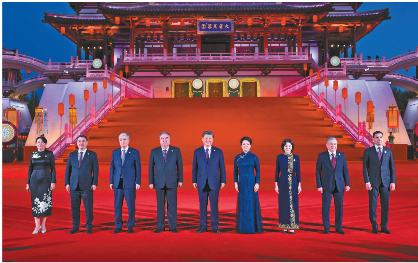
5月18日晚,国家主席习近平和夫人彭丽媛在陕西省西安市大唐芙蓉园为出席中国—中亚峰会的中亚国家元首夫妇举行欢迎仪式和欢迎宴会。宴会后,习近平夫妇同贵宾们共同观看中国同中亚国家人民文化艺术年暨中国—中亚青年艺术节开幕式演出。这是习近平夫妇在紫云楼前同贵宾合影留念。