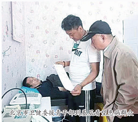
北京市卫健委援青干部到基层看望患病群众