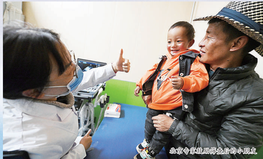
北京专家鼓励筛查后的小朋友