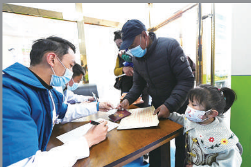
玉树州医院志愿者为来筛查的小朋友进行登记