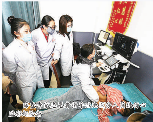
筛查专家志愿者指导当地医务人员进行心脏彩超检查