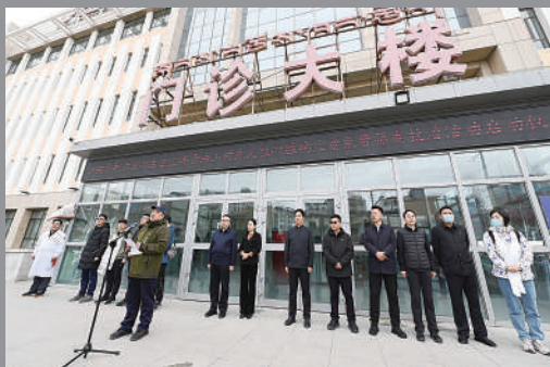
健康边履行——“玉树少年 北京心声”先天性心脏病筛查启动仪式