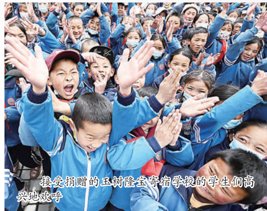
接受捐赠的玉树隆宝寄宿学校的学生们高兴地欢呼