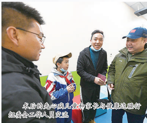
术后的先天性心脏病患儿与家长与健康边履行组委工作人员交流