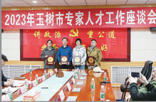
健康边履行专家团队专家受聘为玉树市医疗专家