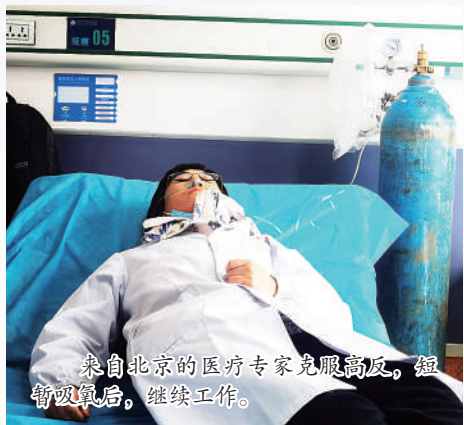
来自北京的医疗专家克服高原、缺氧、低温后，继续工作。