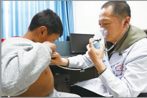
由于高原缺氧，专家一边吸氧一边为孩子们筛查。