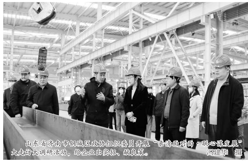
山东省济南市钢城区政协组织委员开展“亲清面对面·联心促发展”大走访大调研活动,给企业出实招、献良策。