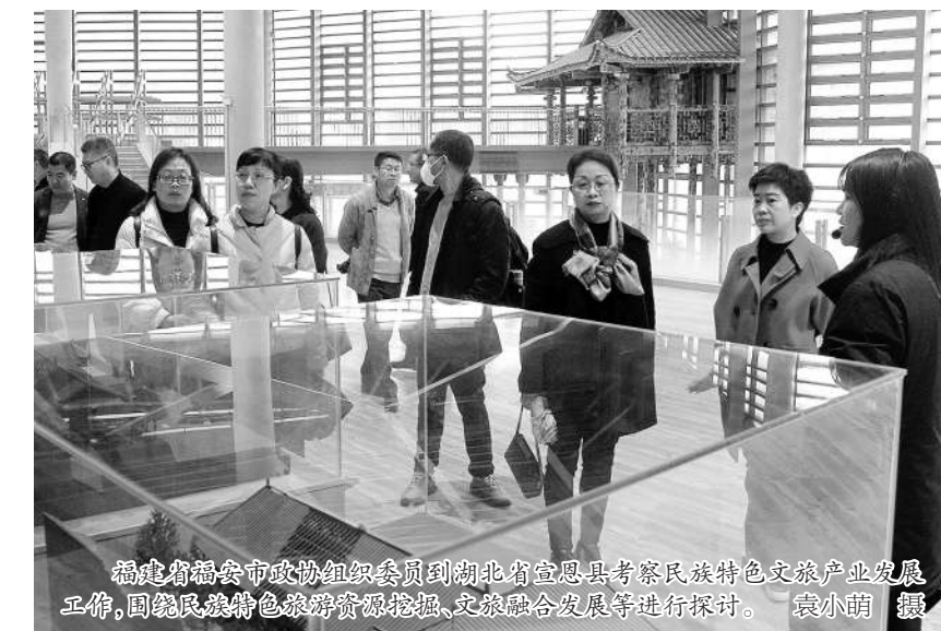
福建省福安市政协组织委员到湖北省恩施州考察民族特色产业工作,围绕民族特色产业资源挖掘、文旅融合发展等进行探讨。