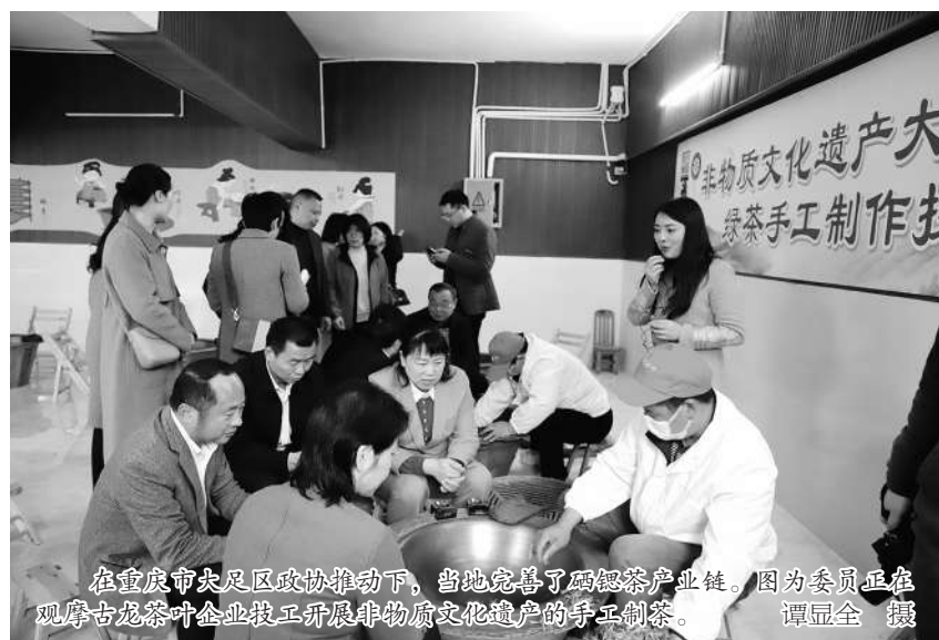
在重庆市中央及区政协推动下,当地完善了磁器口产业链。图为委员正在观摩古龙茶叶企业技工开展非物质文化遗产的手艺制茶。