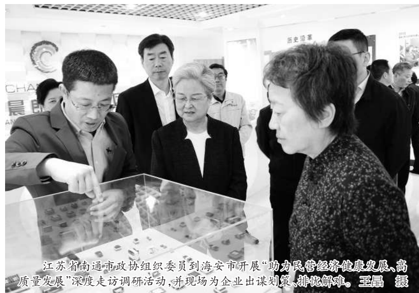
江苏省南通市政协组织委员到海安市开展“助力民营经济健康发展、高质量发展”深度走访调研活动,并现场为企业出谋划策、排忧解难。