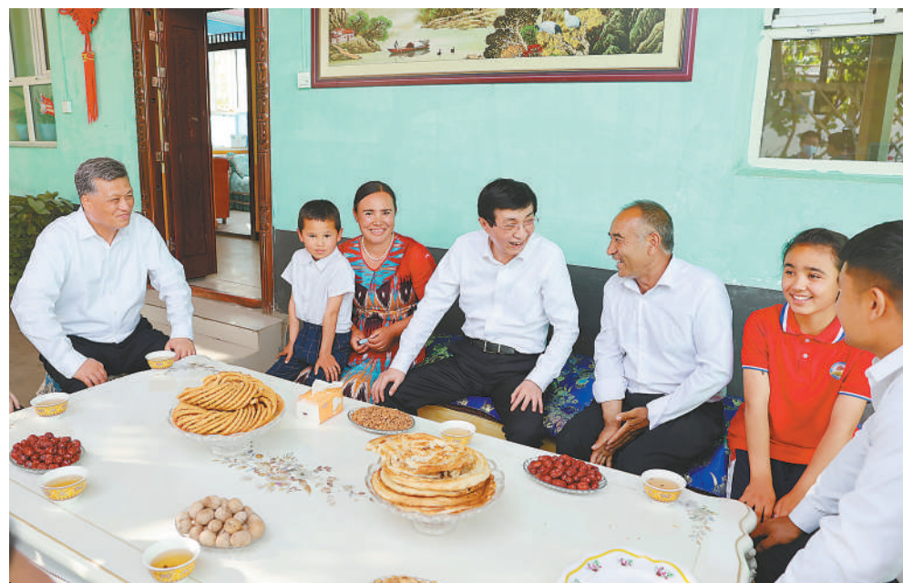
5月22日至24日，中共中央政治局常委、全国政协主席王沪宁在新疆调研。这是5月22日王沪宁在喀什疏附县阿亚格曼干村走访看望维吾尔族家庭。新华社记者 姚大伟 摄

在喀什，王沪宁来到喀什古城、吾斯塘博依街道派出所、艾提尔清真寺、疏附县阿亚格曼干村等，了解开展民族团结、宗教政策落实、基层治理、群众生产生活等情况。（下转2版）