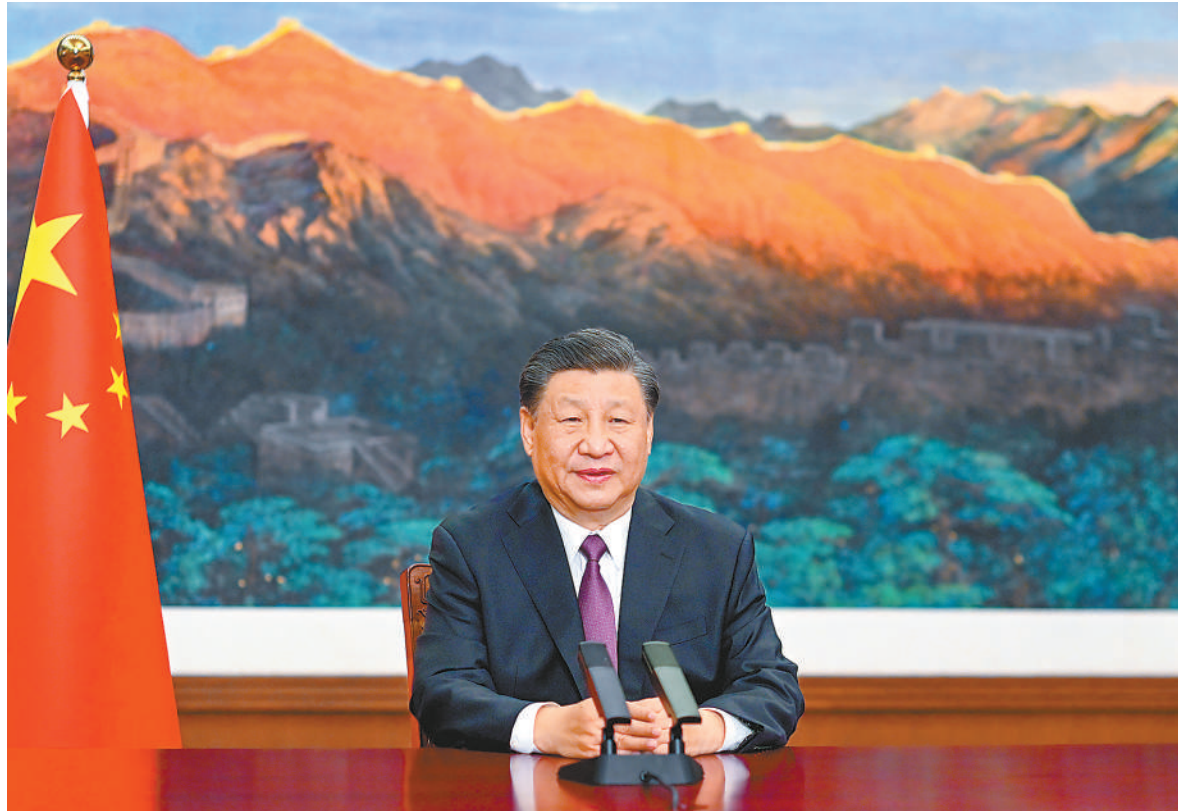
五月二十四日，国家主席习近平应邀以视频方式出席欧亚经济联盟第二届欧亚经济论坛全会开幕式并致辞。

新华社北京5月24日电 5月24日，国家主席习近平应邀以视频方式出席欧亚经济联盟第二届欧亚经济论坛全会开幕式并致辞。