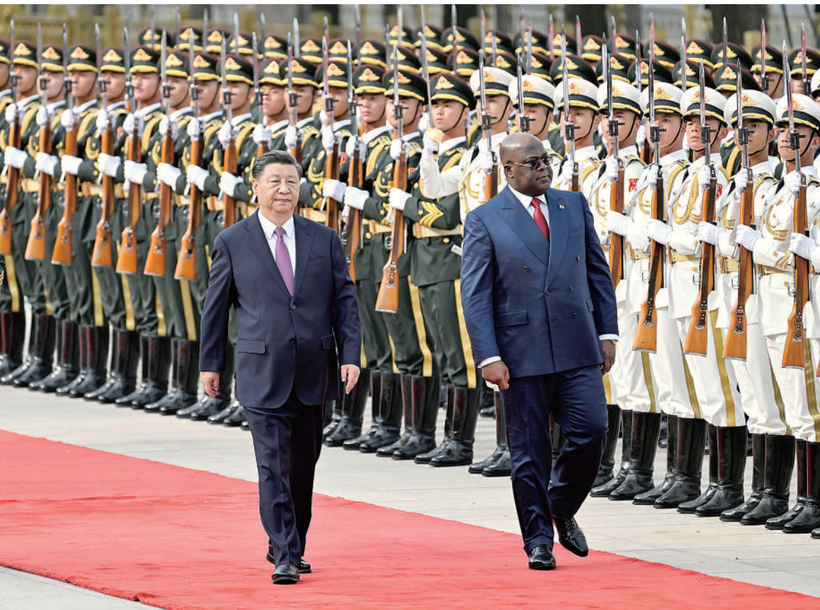
五月二十六日下午，国家主席习近平在北京人民大会堂同来华进行国事访问的刚果(金)总统齐塞克迪举行欢迎仪式。