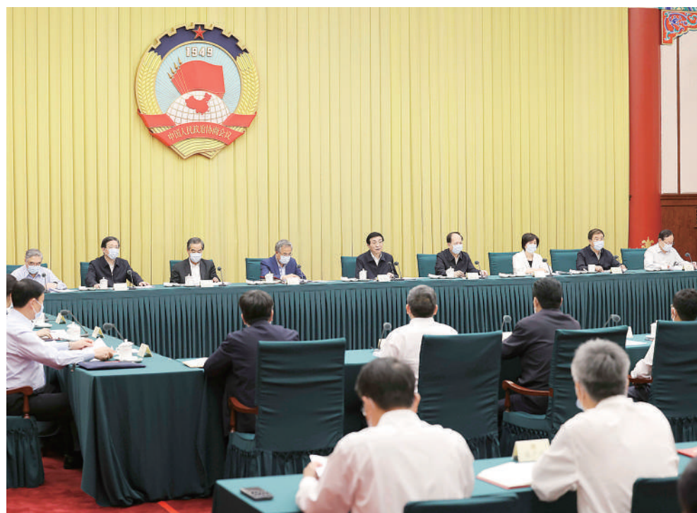
5月26日，十四届全国政协第四次双周协商座谈会在北京召开，中共中央政治局常委、全国政协主席王沪宁主持会议。

本报北京5月26日电 十四届全国政协第四次双周协商座谈会5月26日在京召开，中共中央政治局常委、全国政协主席王沪宁主持会议。他表示，要从新时代民族团结进步事业取得的历史性成就中，深刻领悟“两个确立”的决定性意义，增强“四个意识”、坚定“四个自信”、做到“两个维护”，把思想和行动统一到