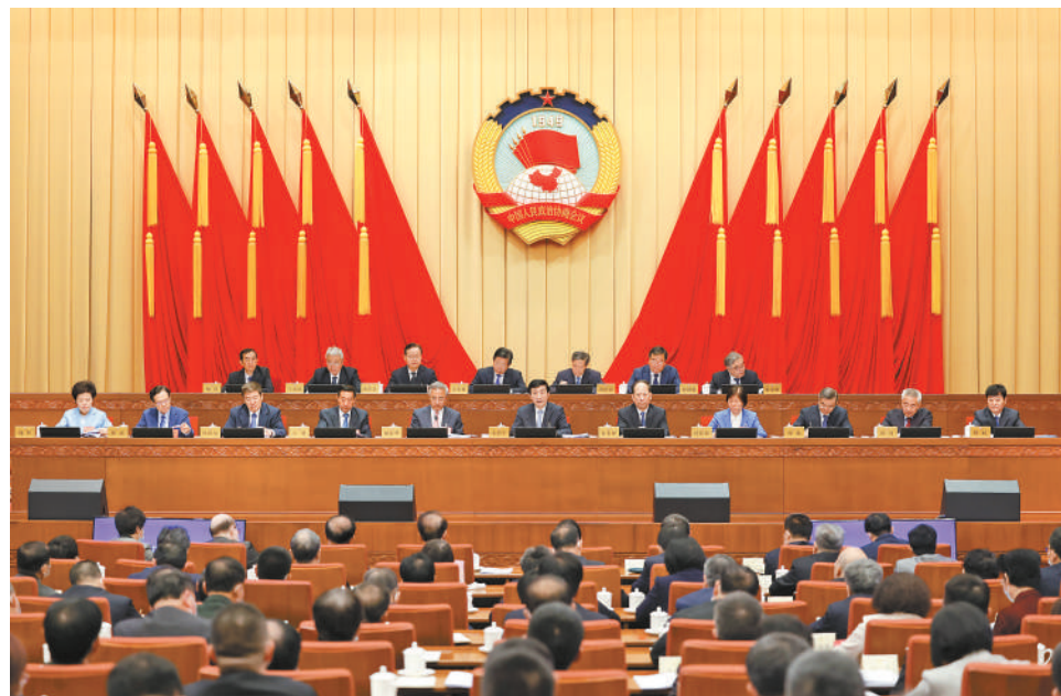
5月30日，十四届全国政协新任委员学习研讨班在北京开班，中共中央政治局常委、全国政协主席王沪宁出席开班式并讲话。

本报讯（记者 吕巍）十四届全国政协新任委员学习研讨班30日在京开班，中共中央政治局常委、全国政协主席王沪宁出席开班式并讲话。他表示，习近平新时代中国特色社会主义思想是当代中国马克思主义、21世纪马克思主义，是党和国家必须长期坚持的指导思想。人民政协要把习近平新时代中国特色社会主义思想作为统领各项工作的总纲，坚持不