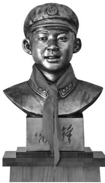
▲戴着红领巾的雷锋塑像（杨肇宇 作品）

经过团课学习，雷锋懂得了中国新民主主义青年团（那时还不叫共青团）的性质、团员的义务和职责等基本知识。他最早向团支部交上一份入团申请书，这之后，他几乎每周都要写一次申请。到1956年雷锋小学毕业时，学生团员才只有几个人，雷锋当时因为年龄小，暂时没有吸收为团员。在别人入团宣誓的时候，他非常羡慕，宣誓仪式上请进步青年代表发言时，他抢先上台发言，他说：“亲爱的老师、同学们！我多么希