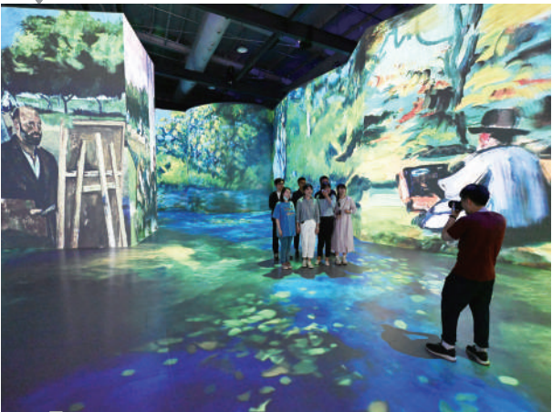
镜像空间沉浸体验