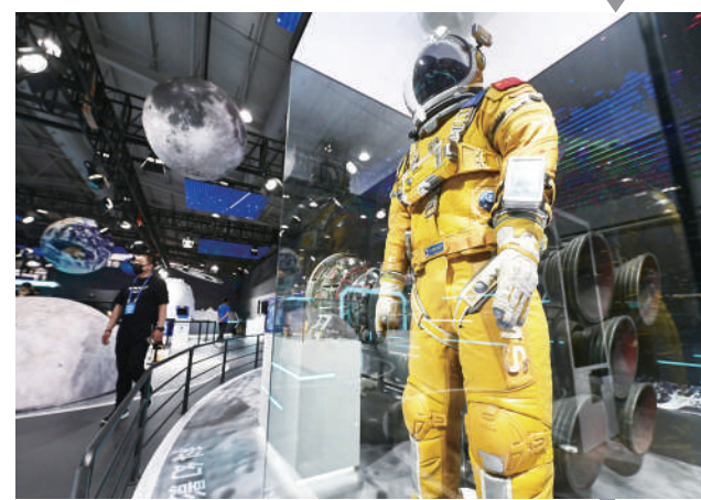
独行月球影视道具