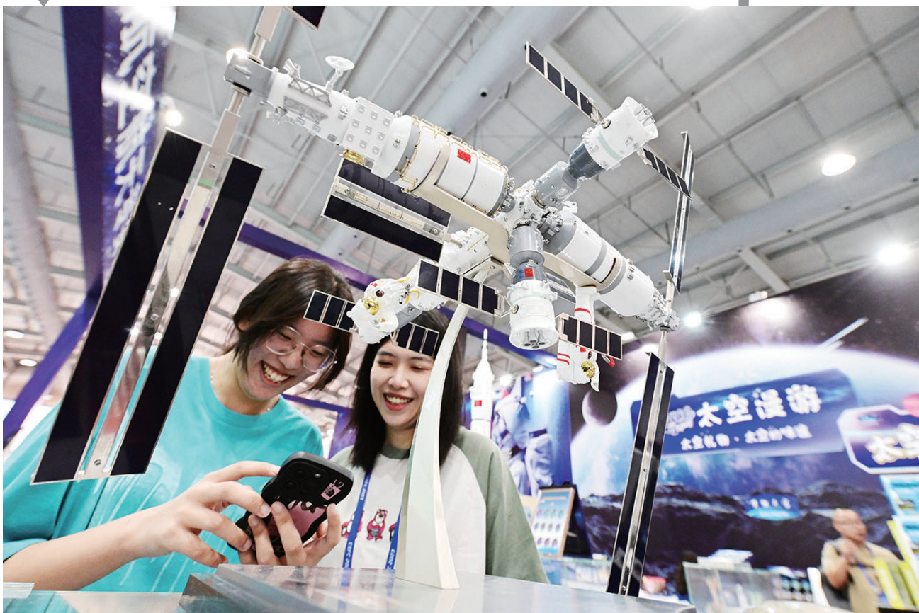
航空周边文创受青睐