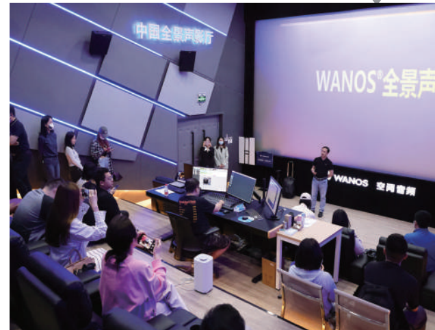
石景山区企业自主研发的高保真全景声体验展示