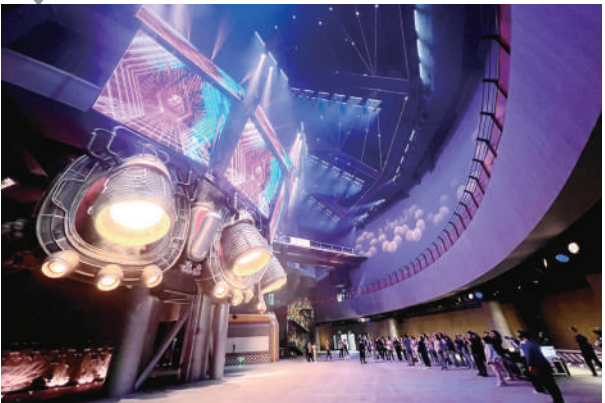
首钢1号高炉内的元宇宙乐园充满科幻色彩