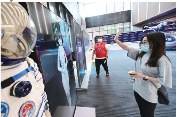
观众和大会标志性形象奇幻互动