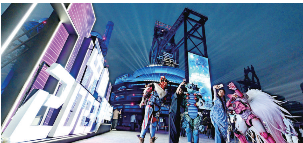
开幕式上科幻人物展示