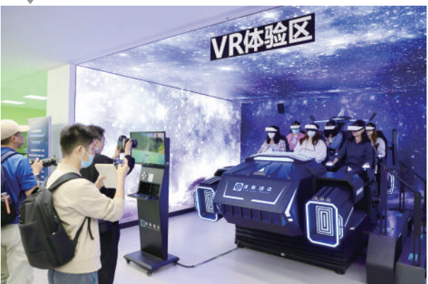
沉浸式互动游戏体验活动