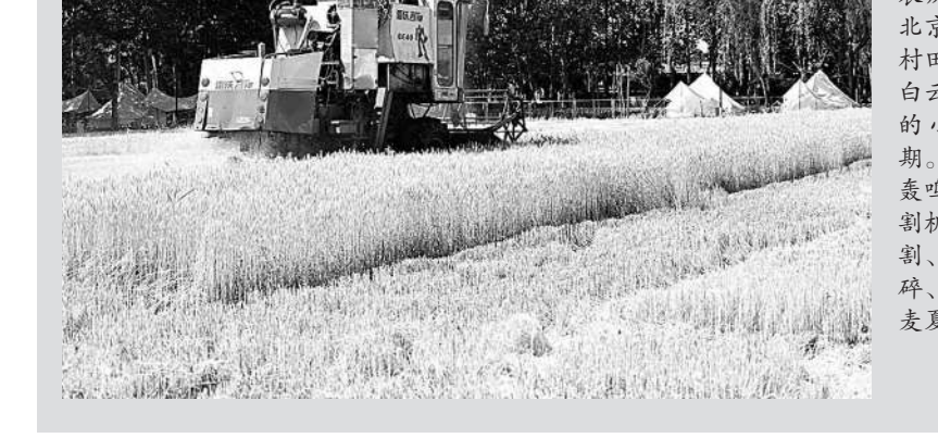
6月6日正值农历“芒种”，在北京通州区小堡村田间地头，蓝天白云映衬下，连片的小麦进入成熟期。随着机械的轰鸣，小麦联合收割机驶入麦田，收割、脱粒、秸秆粉碎、麦粒装车，小麦夏收拉开序幕。

全力抓好祁连山、天山、阿尔泰山、贺兰山、六盘山等区域天然林草植被的封育封禁保护，加强退化林和退化草原修复，确保沙漠源不扩散。 习近平指出，要坚持科学治沙，全面提升荒漠生态系统质量和稳定性。要合理利用水资源，坚持以水定绿、以水定地、以水定人、以水定产，把水资源作为最大的刚性约束，大力发展节水林草。要科学选择植被恢复模式，合理配置林草植被类型和密度，坚持乔灌草相结合，营造防风固沙林网、林带及防风固沙沙漠锁边林草带等。要因地制宜、科学推广应用行之有效的治理模式。 习近平强调，要广泛开展国际交流合作，履行《联合国防治荒漠化公约》，积极参与全球荒漠化环境治理，重点加强同周边国家的合作，支持共建“一带一路”国家荒漠化防治，引领各国开展政策对话和信息共享，共同应对沙尘灾害天气。 习近平最后强调，实施“三北”工程是国家重大战略，要全面加强组织领导，坚持中央统筹、省负总责、市县抓落实的工作机制，完善政策机制，强化协调配合，统筹指导、协调推进相关重点工作。要健全“三北”工程资金支持和政策支撑体系，建立稳定持续的投入机制。各级党委和政府要保持战略定力，一张蓝图绘到底，一茬接着一茬干，锲而不舍推进“三北”等重点工程建设，筑牢我国北方生态安全屏障。 中共中央政治局常委、中央办公厅主任蔡奇陪同考察并出席座谈会。 李干杰等陪同考察并出席座谈会，何立峰陪同考察，马兴瑞及中央和国家机关有关部门负责同志、有关省区负责同志参加座谈会。